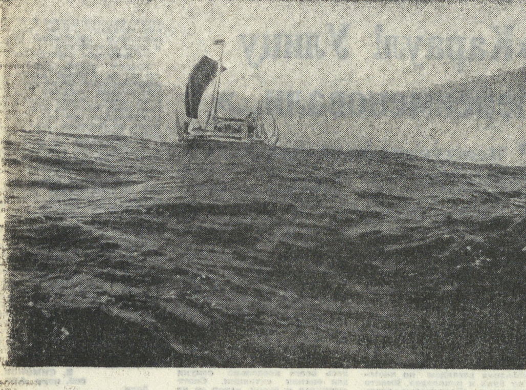
Пашрусное судно «РА-2» (на снимке) успешно завершило свое 57-дневное путешествие. Тур Хейердал и семь членов интернационального экипажа достигли цели своего путешествия — Барбадос, доказав, что 4 тысячи лет назад египтяне могли плавать на папирусных судах в Южную Америку.