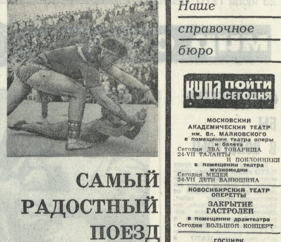
Вот уже полтора месяца совершает свое традиционное путешествие по дорогам Урала поезд искусств, ежегодно организуемый Свердловской государственной филармонией. Поезд везет с собой песни и танцы, музыку и стихи, а пассажиры его — участники концертов — известные актеры театров, кино, эстрады, популярные музыканты, хористы и танцевальные коллективы...