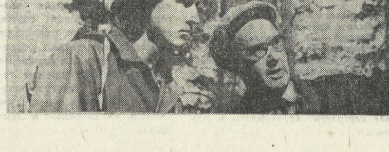
Уралэнергостройцы также помогают трудящимся села на полевых работах. В. ОЛЬКОВА.