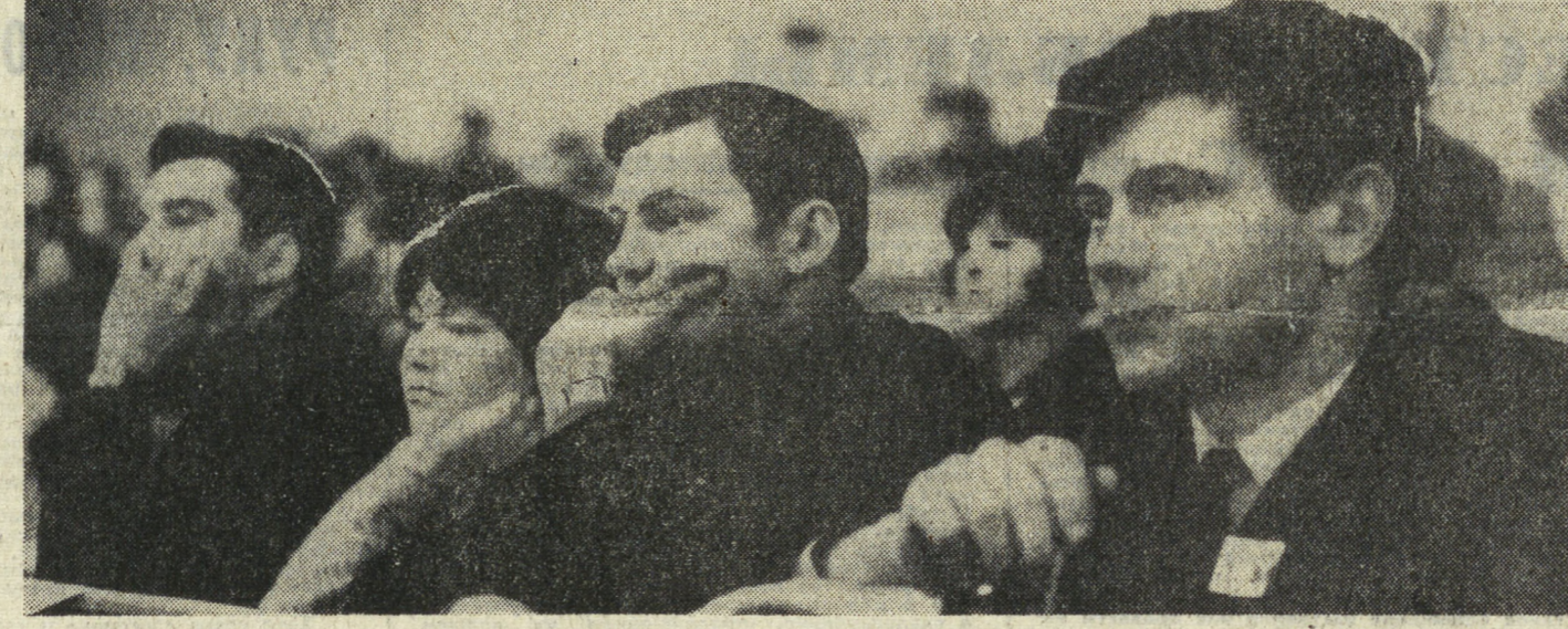
На снимках Л. БАРАНОВА: Летят песни (снимок сверху справа); в зале во время конференции; в перерыве делегаты общаются с мнениями (нижний снимок).