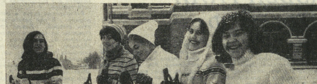
Продукцию Куйбышевской трикотажной фабрики знают далеко за пределами области. Предприятие ежегодно осваивает десятки новых видов изделий. Большое значение уделяется выпуску спортивных костюмов из различных видов трикотажа.