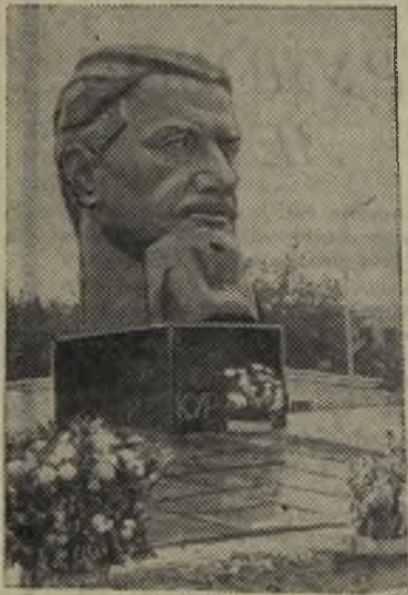
Москва. На днях здесь открыт памятник академику Игорю Васильевичу Курчатову.