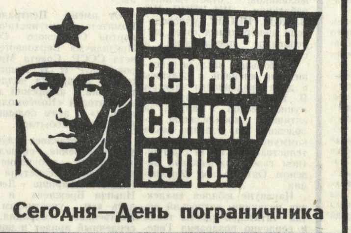
Сегодня — День пограничника