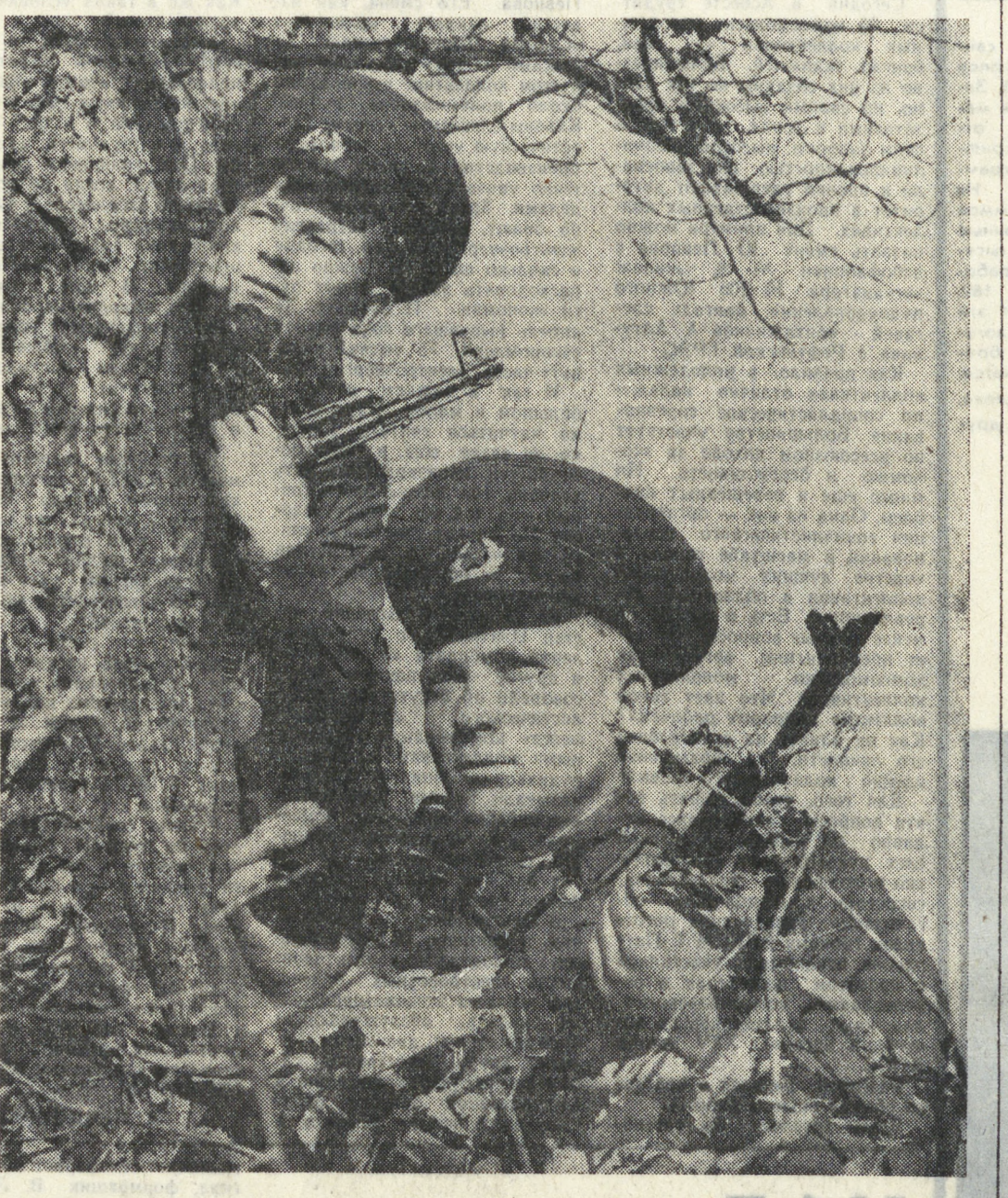
Служба на границе — это большая ответственность. Успешно нести эту службу могут только хорошо подготовленные, прекрасно знающие свои обязанности, находящиеся всегда в боевой готовности солдаты...