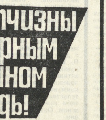
Сегодня — День пограничника