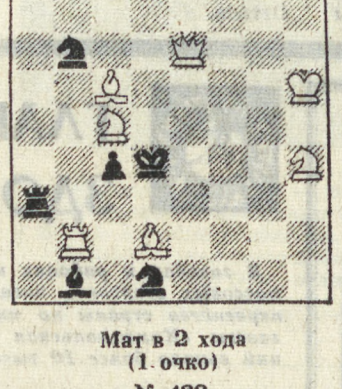
Мат в 2 хода (1 очко) № 434