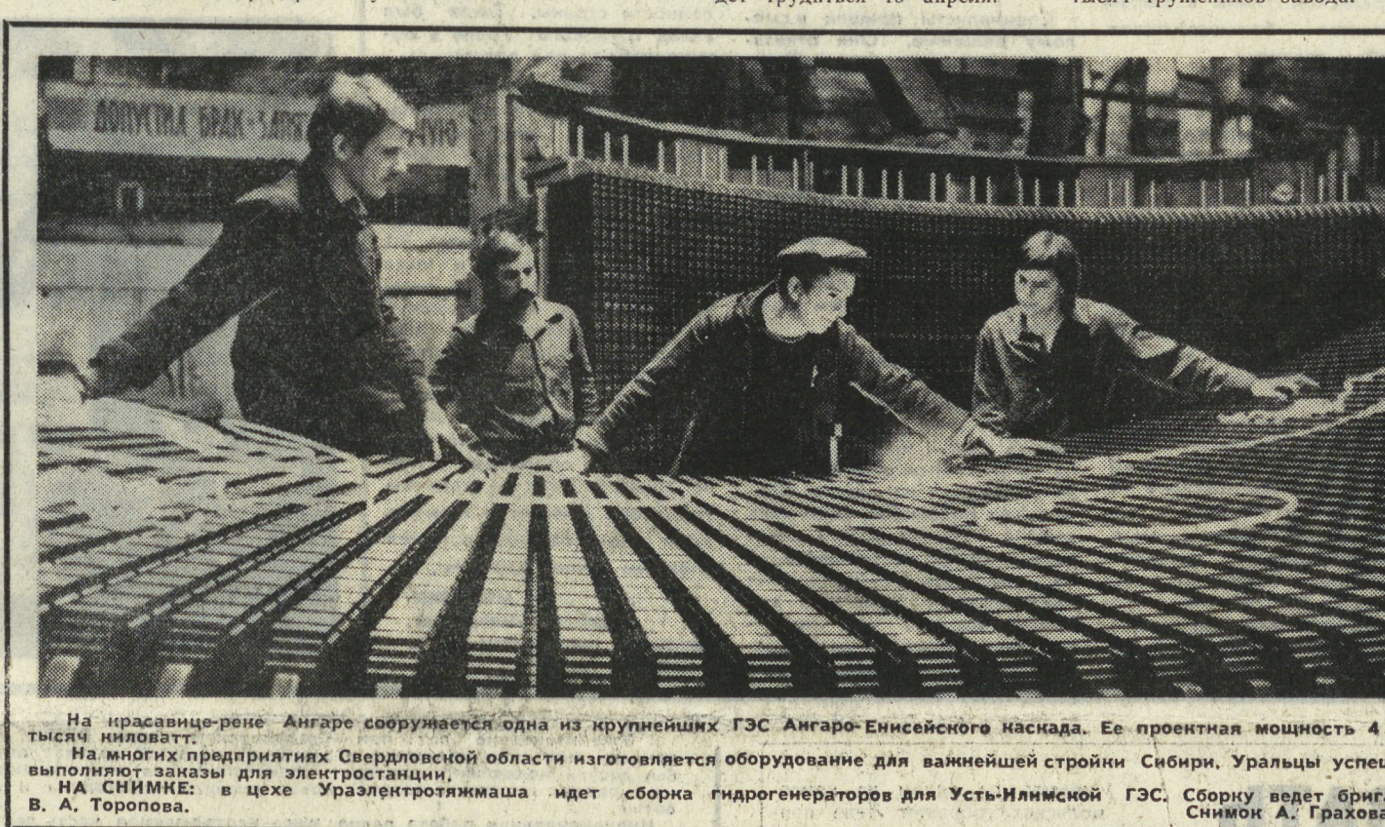
На красавице-реке Ангаре сооружается одна из крупнейших ГЭС Ангара-Енисейского каскада. Ее проектная мощность 4 300 тысяч киловатт. На многих предприятиях Свердловской области изготавливается оборудование для важнейшей стройки Сибири. Уралцы успешно выполняют заказы для электростанций, — снимки в цехе Уралэлектротехмаша идет сборка гидрогенераторов для Усть-Илимской ГЭС. Сборку ведет бригада

Передовой опыт депутатской группы поможет новым составом местных Советов области с самого начала своей деятельности успешно превращать в жизнь указы избирателей.