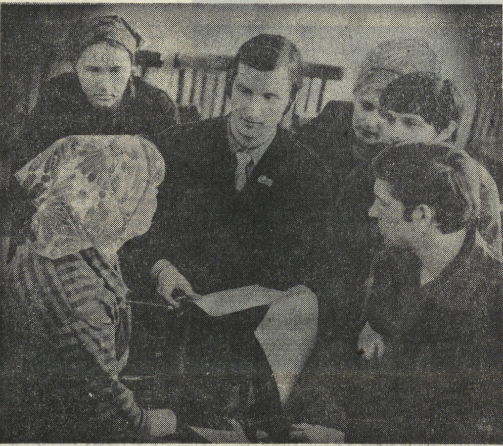
На снимке: группа участников заседания рабочего совета из метизного цеха Уралхиммашзавода.

Сегодня в трудовых коллективах области широко развернуто соревнование по достойной встрече 30-летия великой Победы. В рядах соревнующихся, вместе с ветеранами войны и труда, — тысячи юношей и девушек. Они участвуют в движении «За себя и за того парня», выполняя нормы за погибших фронтовиков. По инициативе комсомольцев Уралагрозавида молодежь создает фонд мирного эшелона вагонов «Свердловский комсомолец». Например, юноши и девушки Уралэлектротракторзавода внесли в этот фонд уже более 200 тысяч рублей, заработанных на субботниках и воскресниках. Молодые труженики области принимают активное участие в соревновании в честь городов-героев.