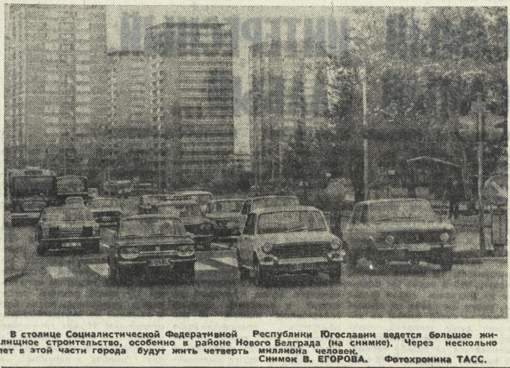
В столице Социалистической Федеративной Республики Югославии ведется большое жилищное строительство, особенно в районе Нового Белграда (на снимке). Через несколько лет в этой части города будут жить четверть миллиона человек.

По данным ЮНЕСКО, для становления науки в развивающихся странах Азии, Африки и Латинской Америки на каждый миллион человек должна приходиться минимум тысяча научных работников.