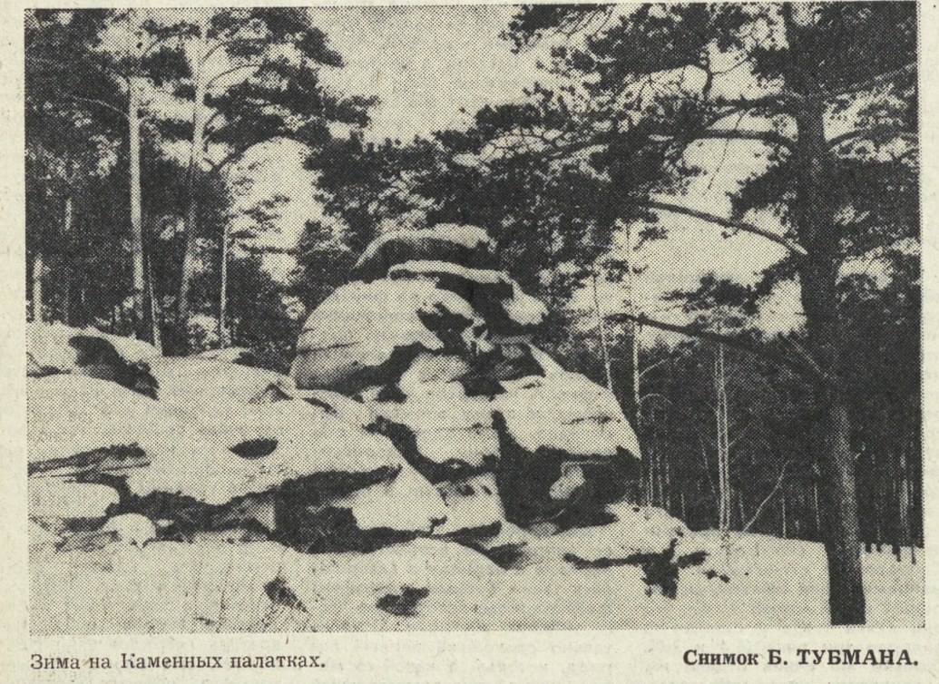
Зима на Каменных палатках.

Живет в ненецком поселке семья. Самый старший в ней — дедушка Ай-По. Это очень мудрый и веселый человек, он знает очень много обо всем, что происходит в мире, он добрый человек. И еще дедушка Ай-По рассказывает сказки. Сказки такие же, как и он сам, — добрые и мудрые. КНИГА Ю. АФАНАСЬЕВА «СКАЗКИ ДЕДУШКИ АЙ-ПО», ВЫПУЩЕННАЯ СРЕДНЕ-УРАЛЬСКИМ ИЗДАТЕЛЬСТВОМ, ПРЕДИЗНАЧЕНА ДЛЯ СРЕДНЕГО И СТАРШЕГО ШКОЛЬНОГО ВОЗРАСТА. ИЗ НЕЕ РЕБЯТА УЗНАЮТ О ЖИЗНИ СЕВЕРНОГО НАРОДА, ПОЗНАКОМЯТСЯ С НЕНЕЦКИМИ ЛЕГЕНДАМИ.