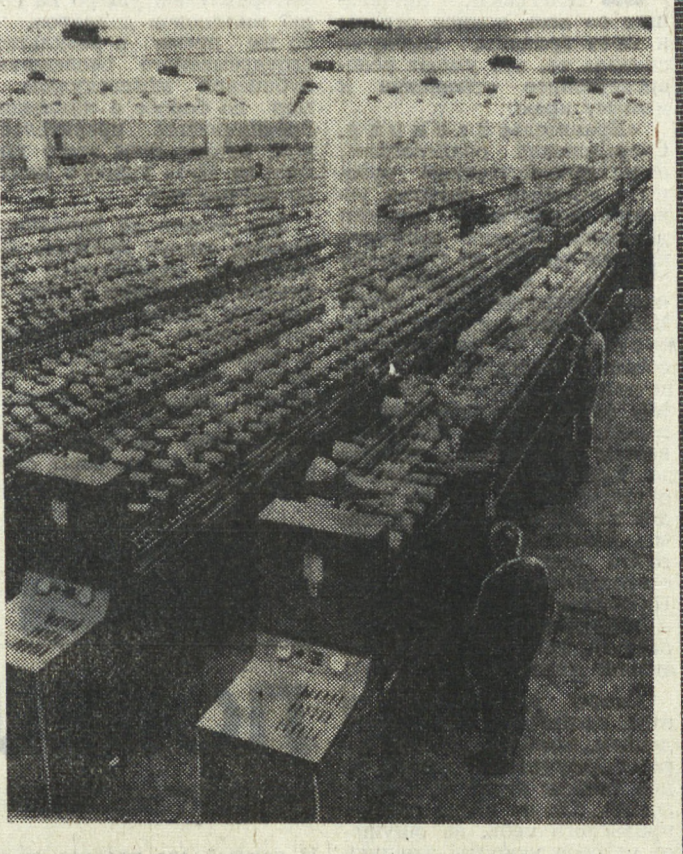
Построенная в Арабской Республике Египет с помощью ГДР текстильная фабрика в городе Шибин-эль-Ком производит ежегодно до 8 тысяч тонн хлопчатобумажной пряжи. ГДР, которая предоставляет долговременные кредиты и предоставляет торговый партнером — с 1973 года более половины продукции фабрики поставляет в ГДР, что позволяет предприятию постепенно погашать свою задолженность.