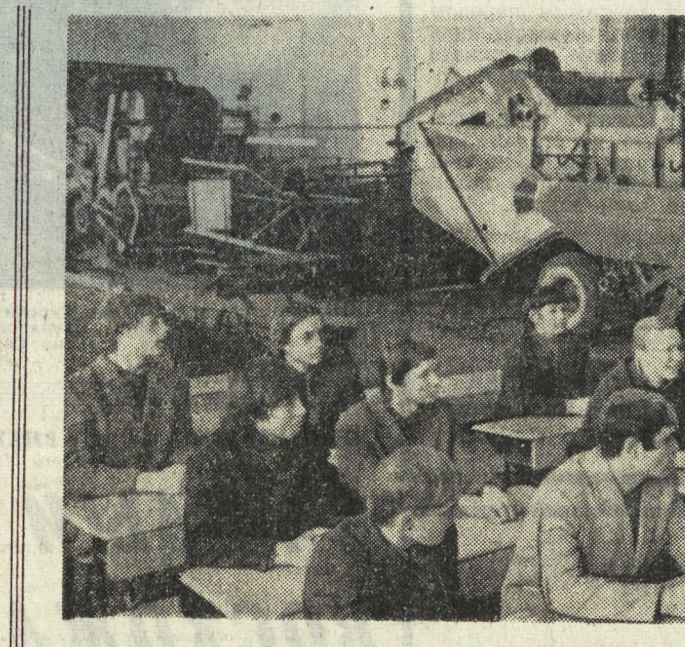
Московская область. Недалеко от города Щелково расположились корпуса сельского профессионально-технического училища № 2, в котором готовят трактористов-машинистов широкого профиля. Учатся одновременно с профессией получают здесь и среднее образование.