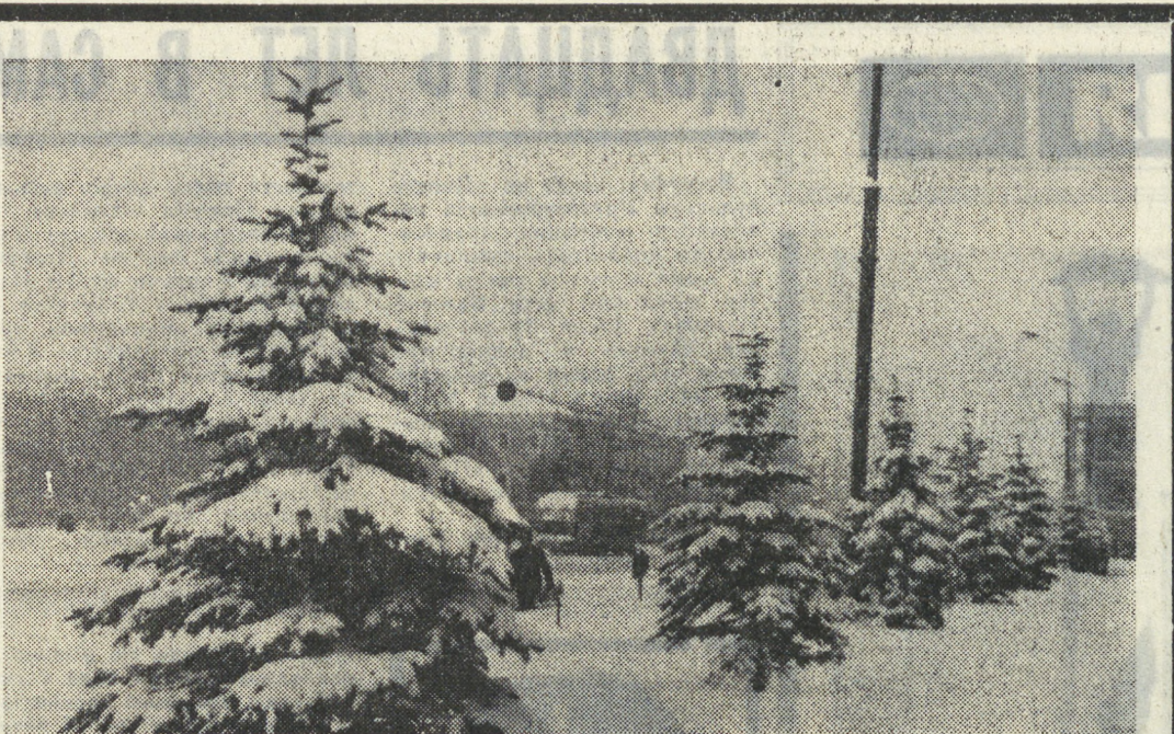
Зима в Свердловске.