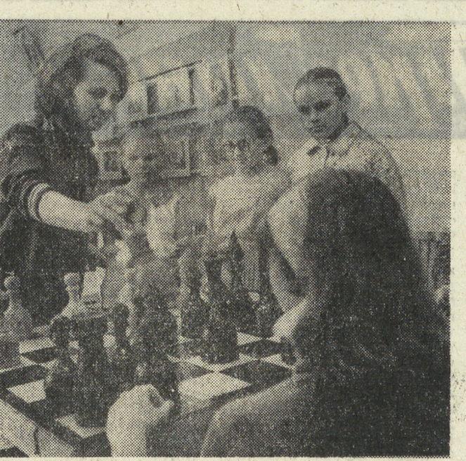
Поистине «гулливерами» кажутся фигуры необычных шахмат, изготовленных рабочими завода «Уралец», что в поселке того же имени близ Нижнего Тагила. Рабочие подарили эти шахматы-великаны заводскому клубу. А желаемое провести за ними свое свободное время всегда есть.

Итак, подведем итог сказанному. Масштабный маневр команды, складывающийся из энергии, скорости и общего маневра полевых игроков, является одним из главных средств тактики интенсивной игры в современном футболе.