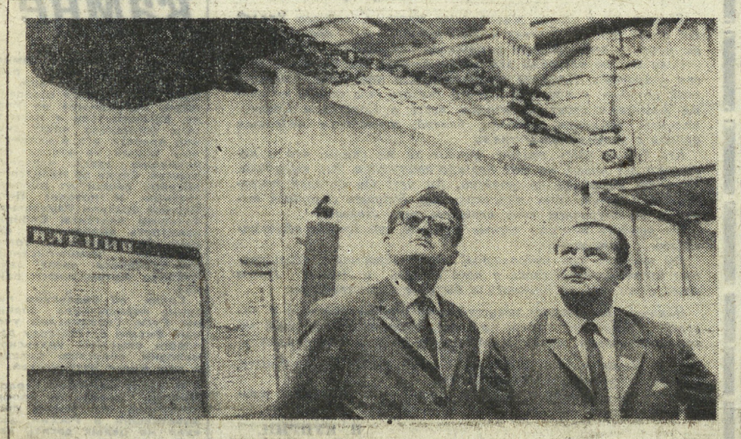
На снимке А. НАГИБИНА: гости из Западной Чехии в одном из цехов Уралмаша.

сваливается в бетонопровод. Только за счет улучшения организации труда в бригаде, применения новой техники и передовых методов труда производительность за квартал повысилась на 12 процентов. При этом проходческие работы выполняются в сложных гидрогеологических условиях. Коллектив бригады Кобзарева из месяца в месяц перевыполняет свое задание. В результате досрочно подготовлены и сданы под монтаж электроподстанция на горизонте 230 метров и камера лебедок для углубления ствола. Так практическими делами бригада коммуниста Кобзарева отвечает на Письмо ЦК КПСС, Совета Министров СССР, ВЦСПС и ЦК ВЛКСМ «Об улучшении использования резервов производства и ускорении темпов экономического в народном хозяйстве». И. ЗЛОВИНА, начальник группы технической информации треста «Ортехстрой».