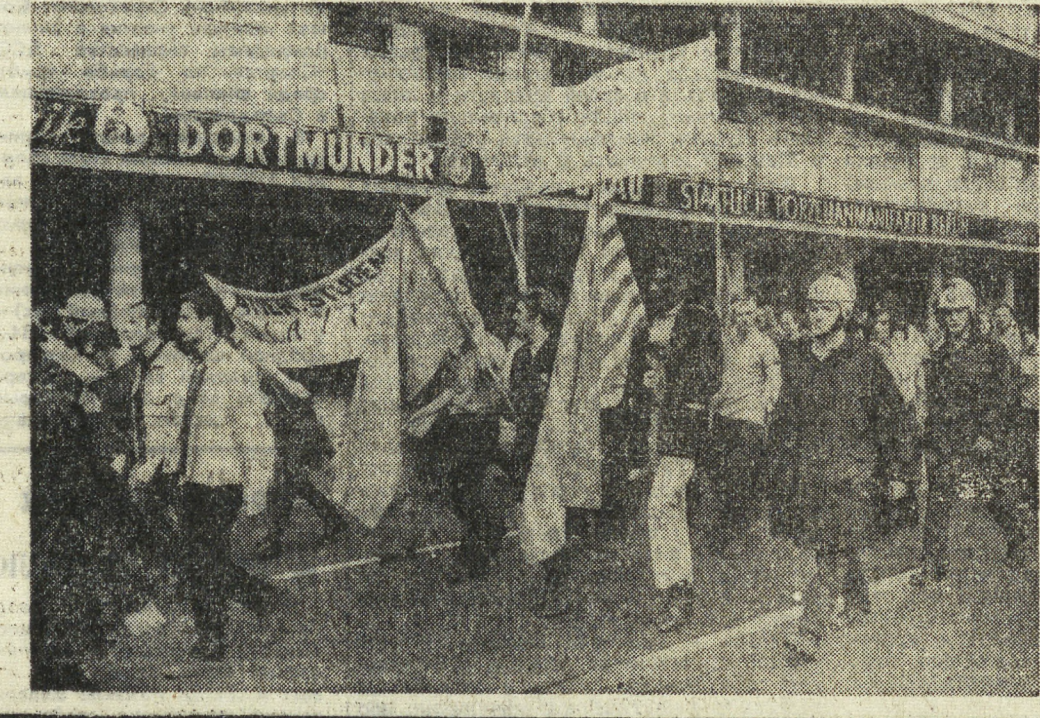
В Западном Берлине не прекращаются выступления прогрессивной общественности города против агрессии США в Индокитае. Большая демонстрация в знак протеста против вторжения американских войск в Камбоджу была проведена у здания американского пропагандистского центра «Америка-хауз».

Западногерманские комментаторы пишут, что 62-