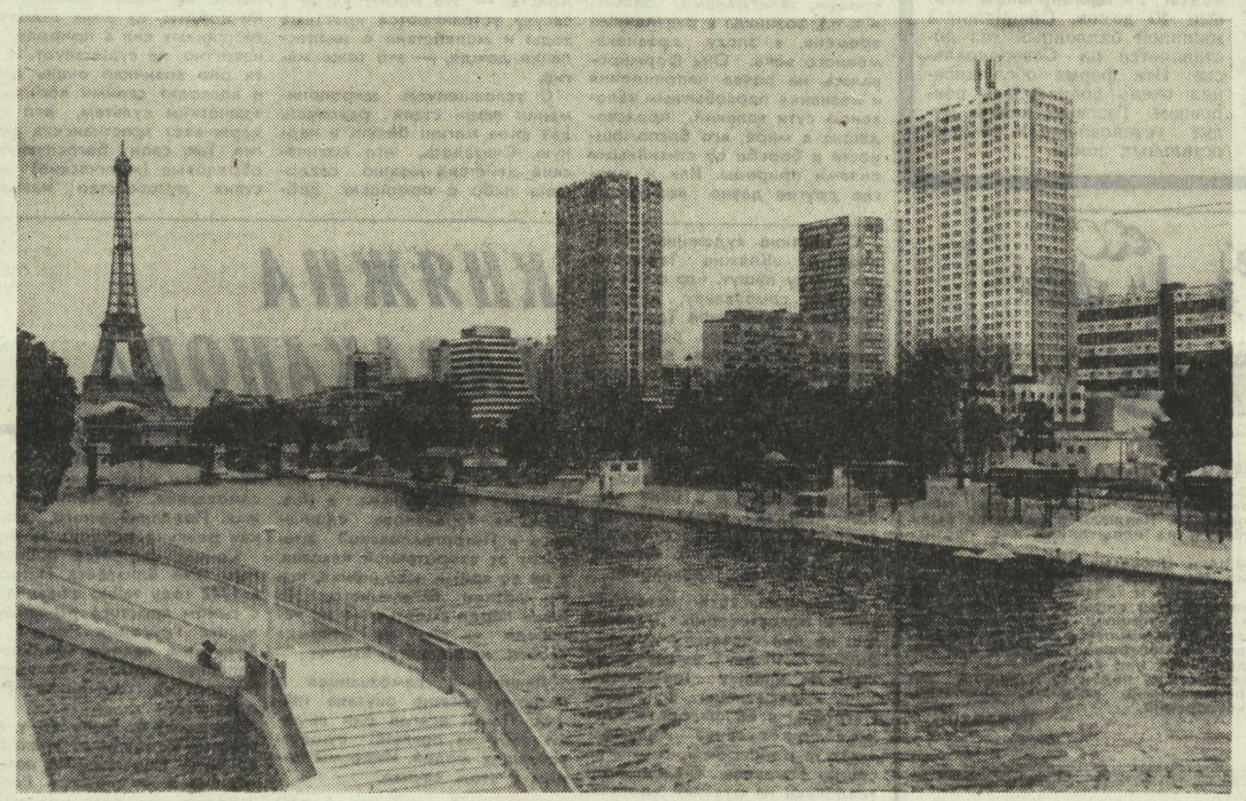
СТОЛИЦА ФРАНЦИИ — ПАРИЖ. Дома-новостройки на левом берегу Сены близ Эйфелевой башни.

Опущена флаги VII областного студенческого спортивного фестиваля. В течение почти двух месяцев шли состязания по олимпийским видам спорта среди сборных команд учебных групп, курсов, факультетов и спортивных клубов студенческого спортивного общества «Студенчество». В соревнованиях приняло участие 47 тысяч студентов-физкультурников, многие выполнили спортивные разряды. Наибольшее число вышедших на старт было в Свердловском педагогическом институте, Уральском лесотехническом и Уральском политехническом институтах, Нижнетагильском педагогическом и Свердловском горном институтах. А. ПОВОП, судья первой категории.