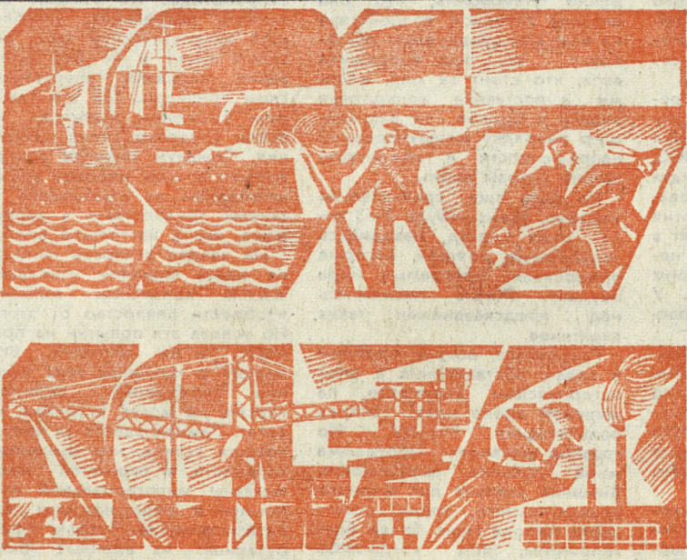
Плакат художника Р. КАПТИКОВА.