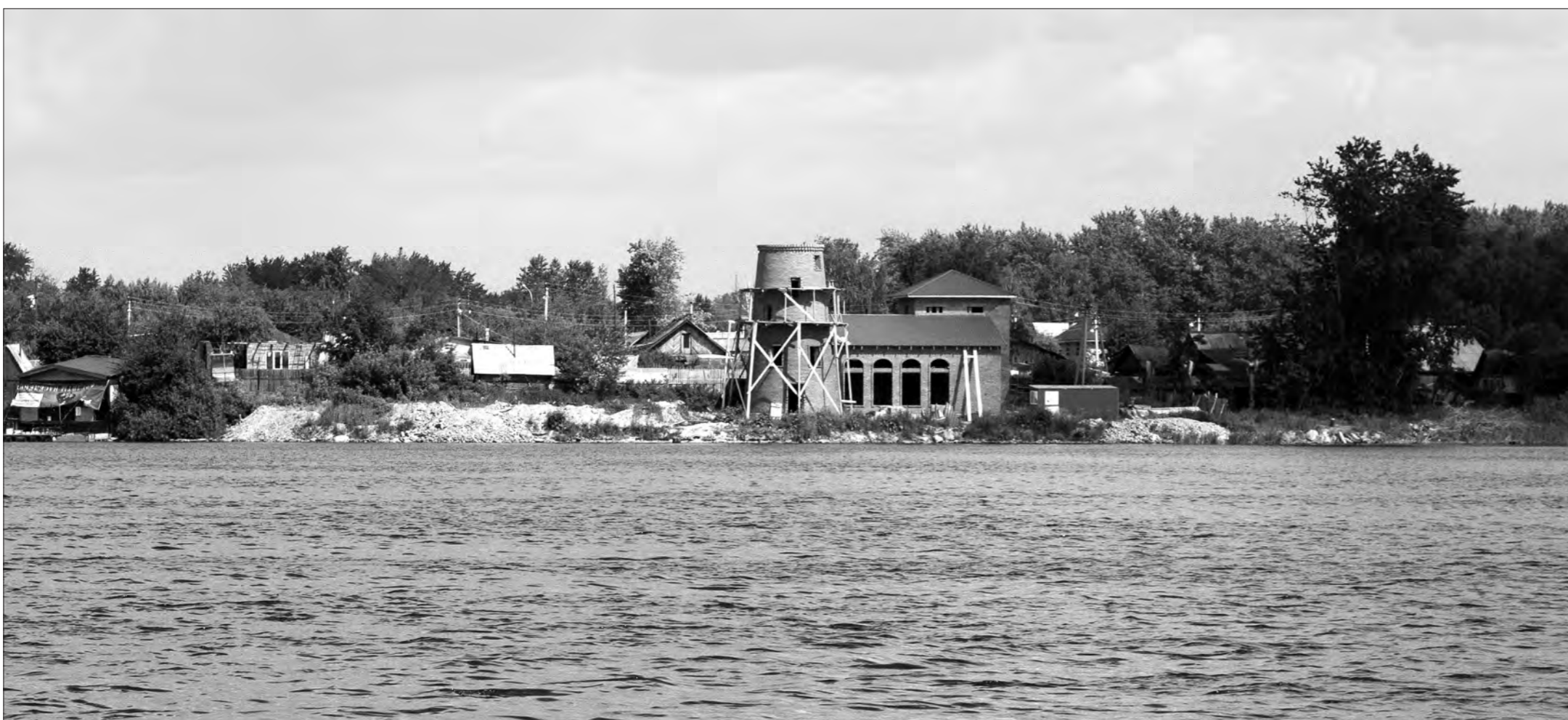
Еще один тяжелесный особняк у самой воды, хотя берег пруда – зона общего пользования.