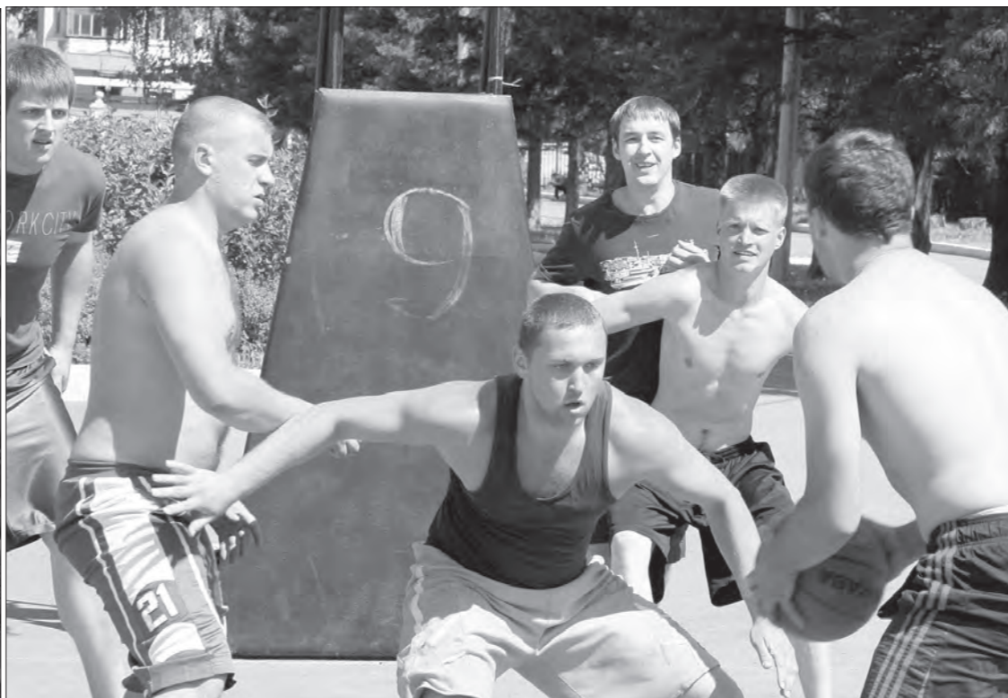
Несмотря на то, что в субботу жара спала, на площадках было очень жарко.

В субботу город отмечал День молодежи. Одним из главных мероприятий стал II Открытый чемпионат по стритболу ОАО «Научно-производственная корпорация Уралвагонзавод», впервые прошедший на площади Дворца культуры имени И.В. Окунова.