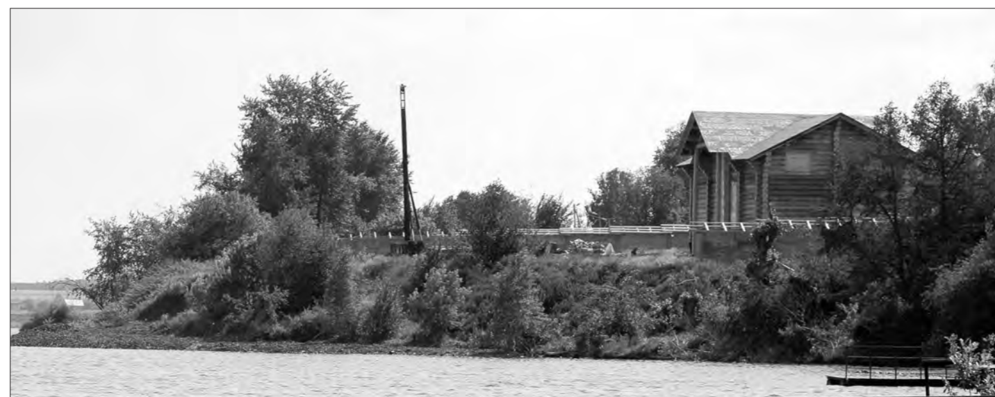
На участке забивают сваи.