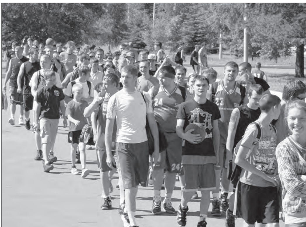
Все – на стритбол!