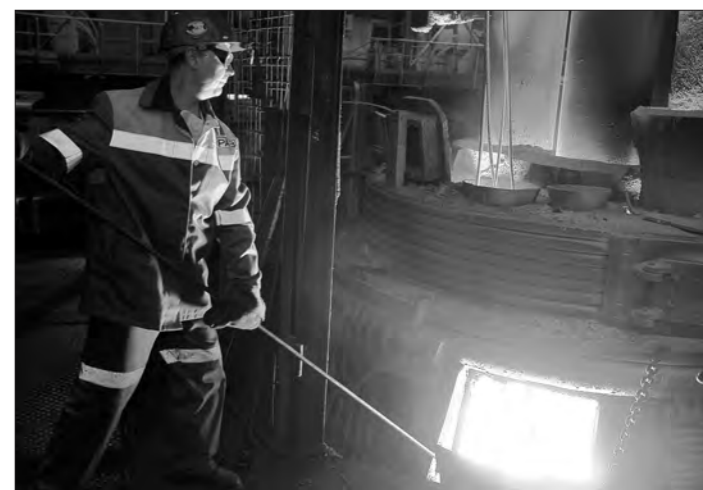
Отбор пробы металла.

На ЕВРАЗ НТМК прошел конкурс профессионального мастерства на звание «Лучший молодой рабочий» среди подручных сталевара конвертерного цеха.