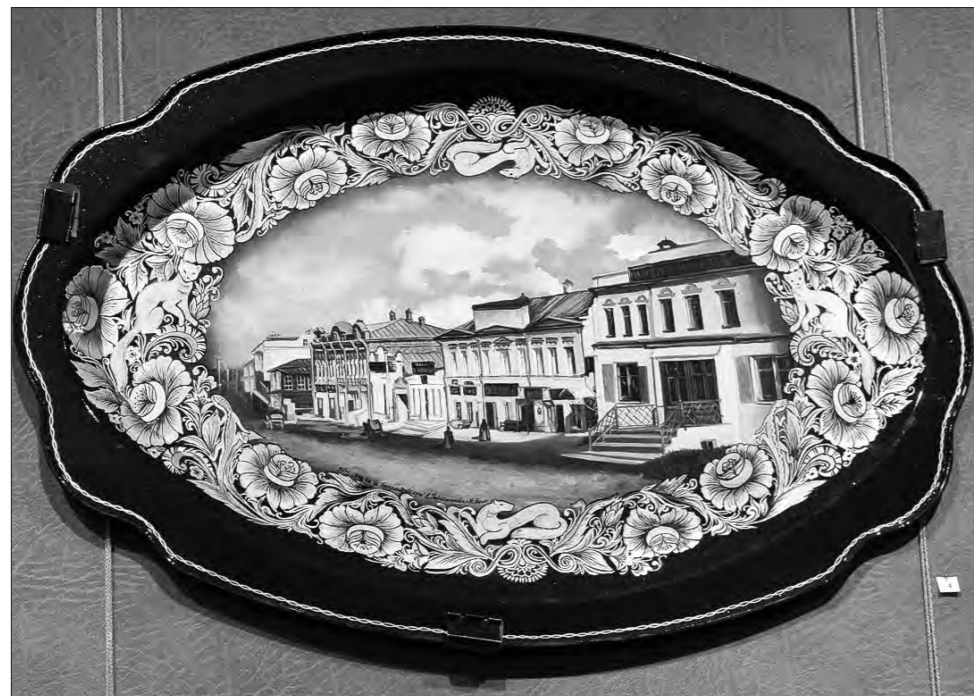
«Вид на улицу Александровскую», Е. Новокошнова.