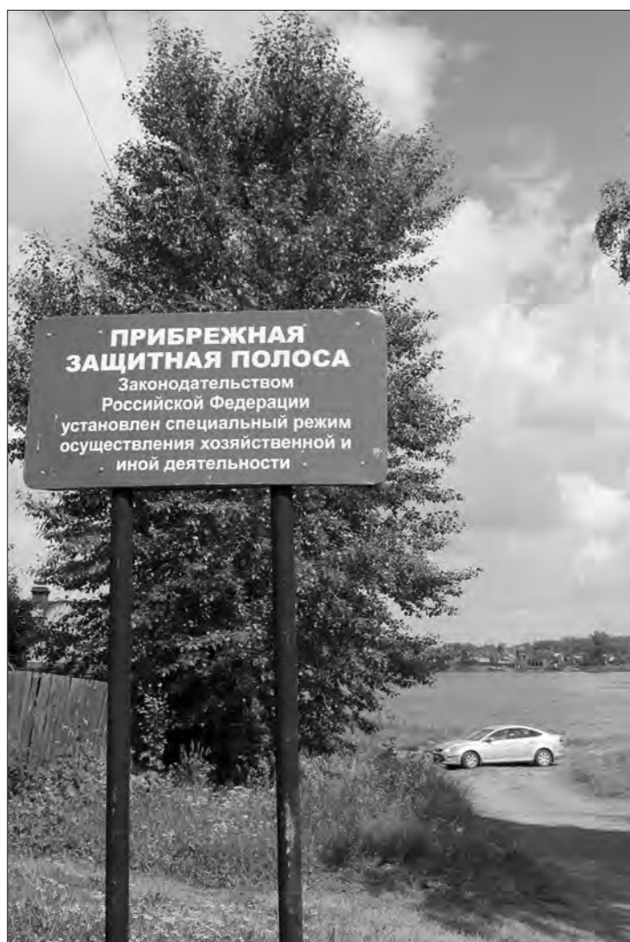
20 метров от берега Тагильского пруда вглубь старой Гальянки – прибрежная защитная полоса.

Анастасия ВАСИЛЬЕВА.