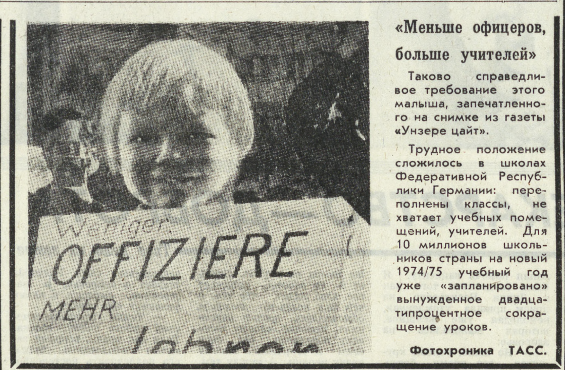
«Меньше офицеров, больше учителей»

Таково справедливое требование этого мальчика, запечатленного на снимке из газеты «Унзере цайт».