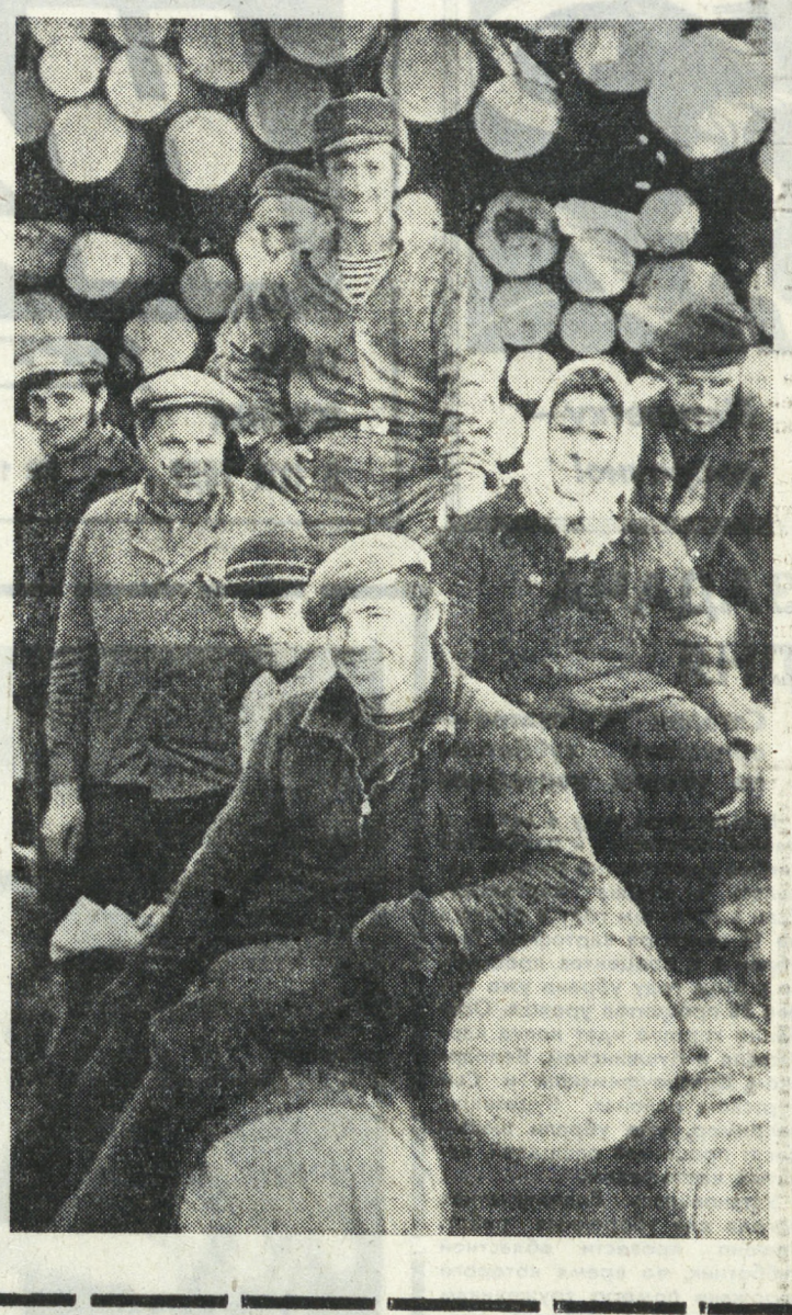
На снимках А. ЛЫСЯКОВА: погрузка деловой древесины; передовая бригада Карабашского леспроектирования...