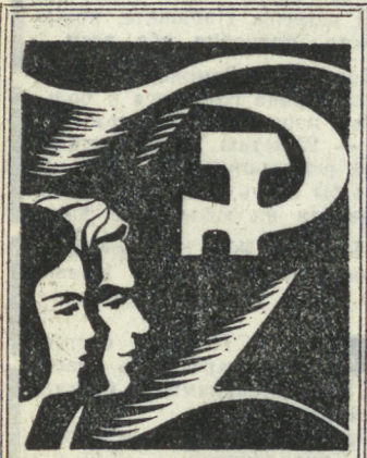
Пятилетку — досрочно!

Ханизированные отряды и звенья по скирдованию соломы, обеспечению полных сборов соломой и полова в период уборки зерновых культур.