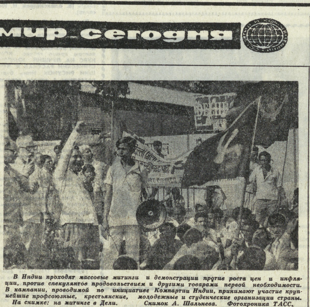
В Индии проходят массовые митинги и демонстрации против роста цен и инфляции...