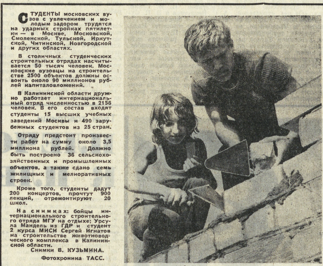
СТУДЕНТЫ мостовских вузов с увеличением и молодым задором трудятся на ударных стройках пятилетия — в Москве, Московской, Смоленской, Тульской, Иркутской, Читинской, Новгородской и других областях. В столичных студенческих строительных отрядах насчитывается 50 тысяч человек. Московские вузовцы на строительстве 2500 объектов должны использовать около 90 миллионов рублей капиталовложений. В Калининской области дружно работают интернациональный отряд численностью в 2136 человек. В его состав входят студенты 12 высших учебных заведений Москвы и 480 зарубежных студентов из 25 стран. Отряду предстоит произвести работ на сумму около 3,5 миллиона рублей. Должно быть построено 36 сельскохозяйственных и промышленных объектов, а также сдано семь жилищных и меллоративных строен. Кроме того, студенты дадут 200 концертов, прочтут 900 лекций, отремонтируют 20 школ. На сменяемых бойцах интернационального строительного отряда МГУ на отдыхе: Урусланов Мамедиз ДДР и студент 2 курса МИСИ Сергей Игнатов на строительстве животноводческого комплекса в Калининской области.