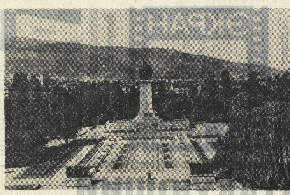
9 сентября народ Болгарии отмечает свой большой праздник — 30-летие социалистической революции. За прошедшие годы Народная Республика Болгария с помощью Советского Союза и других стран социалистического содружества из отсталой, аграрной страны превратилась в государство с высокоразвитой промышленностью, сельским хозяйством, передовой культурой. На снимке — памятник Советской Армии в Софии.

Д. ПЛОТКОВСКИ, польский журналист, (АПН). Варшава.