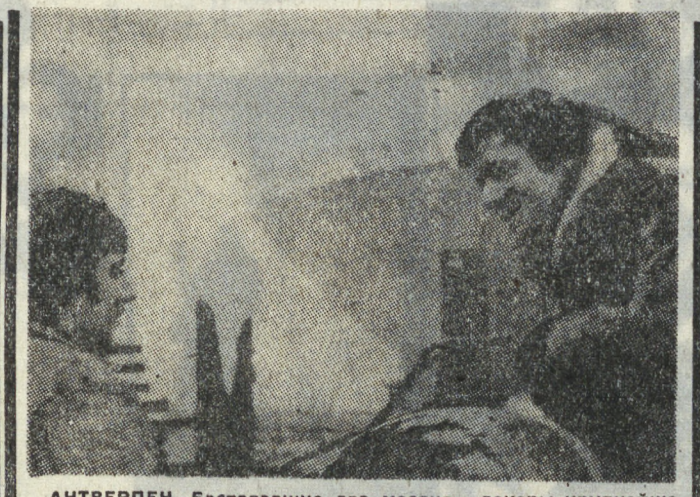
АНТВЕРПЕН. Бастовавшие два месяца докеры крупнейшего порта Западной Европы (100 километров причалов, 18 тысяч судов в год) вернулись на свои рабочие места, добившись повышения заработной платы. Победа дочерей одержана в условиях обострения классовых противоречий в стране. На снимке: пикетчики в порту Антверпена.

Признаюсь, у себя на родине я наслушался много всякой чепухи о Советском Союзе. Нам представляли дело так, будто страна наводнена полицейскими и тайными агентами, будто здесь никто не смеет свободно говорить и