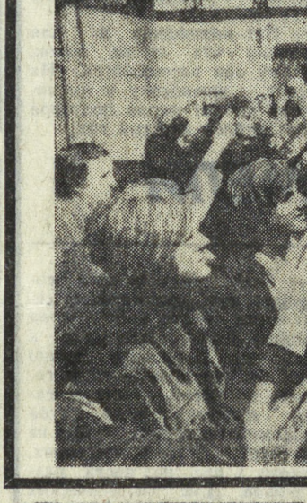
нам только что сообщил телетайп