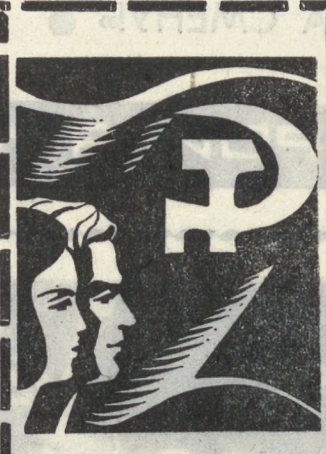
Пятилетку — досрочно!

ОСНОВАНА В 1920 ГОДУ № 171 (9768) ЧЕТВЕРГ, 29 АВГУСТА 1974 ГОДА Цена 2 коп.