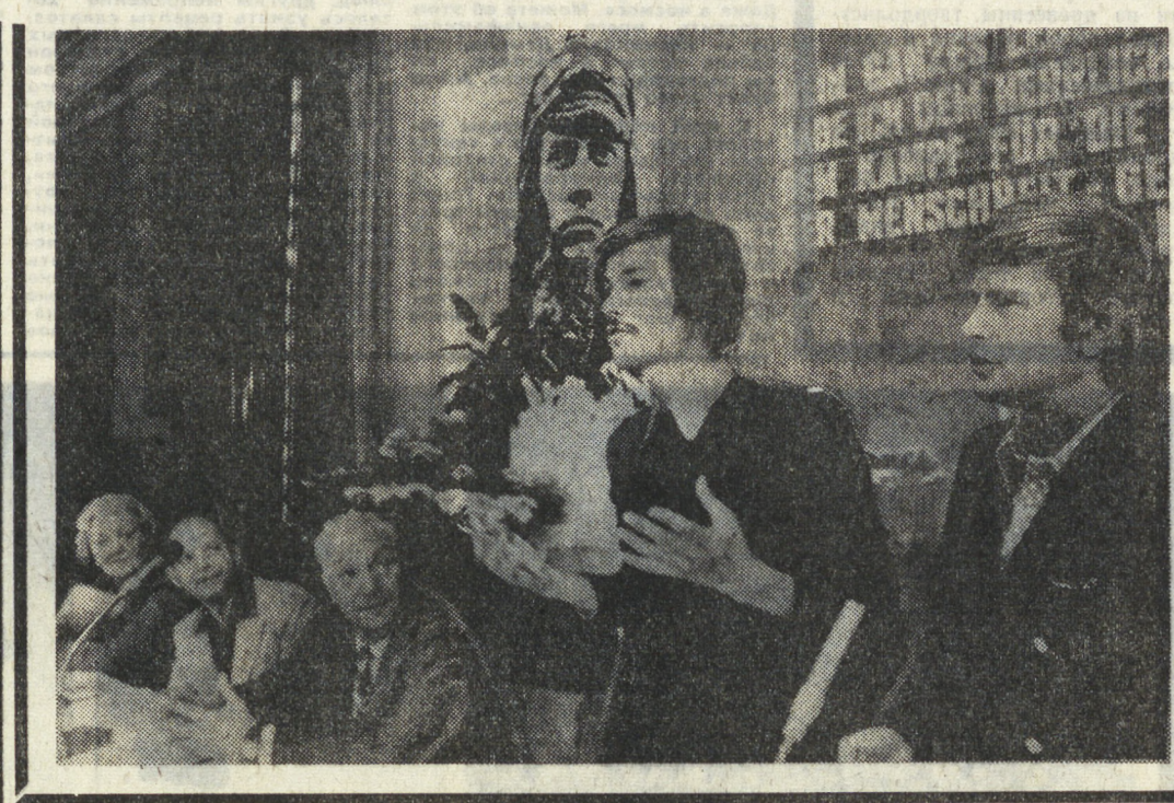
НАМ ТОЛЬКО ЧТО СООБЩИЛ ТЕЛЕТАЙП

Ежегодно обком ССМ проводит конкурс молодых рационализаторов. Так, только в прошлом году на конкурс поступило 41 раппредложе-