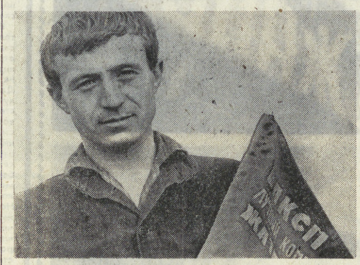
ЛУЧШИЙ ИЗ ЛУЧШИХ

Сегодня Чехословакия торжественно отмечает свой национальный праздник — 30-летие Словацкого национального восстания против немецко-фашистских захватчиков.