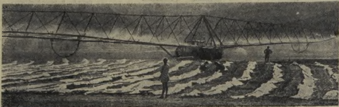
Читинская область. Совхоз «Кенонский» — крупнейший в забайкалье поставщик овощей. На всех площадях, где высажены огурцы, помидоры, капуста, морковь, работают поливальные установки (на снимке).

Таким коммунистам не место в рядах нашей партии. Злостным прогульщикам, пьяницам, нарушителям трудовой дисциплины не должно быть места в социалистическом обществе. И давно пора от слов переходить к решительным мерам воздействия. Необходимо вокруг пьяниц создавать такую обстановку, чтобы земля горела у них под ногами.