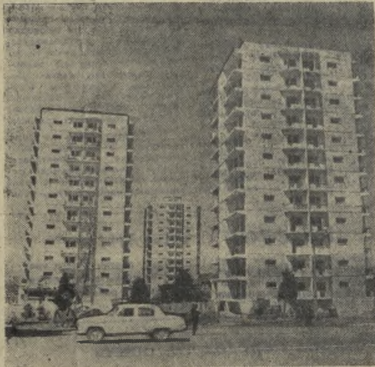
Столица Аджарии Батуми — один из красивейших городов Черноморского побережья. Здесь ведется большое жилищное, культурно-бытовое и промышленное строительство. На снимке: 12-этажные дома по улице Грибоедова.