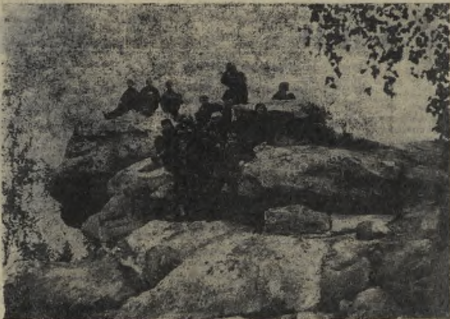
На вершине Седого Урала.