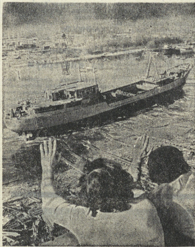
БУДАПЕШТ. На Андялфальдской верфи Венгерского судостроительного и крашеного завода спущено на воду 1500-тонное морское грузовое судно «Рапла» (на снимке), построенное по заказу Советского Союза.

БЕЛГРАД. Больших успехов добилось крупнейшее в Югославии хозяйство «Рыбпродукт» по разведению форели и других видов рыб, расположенное в Черногории.