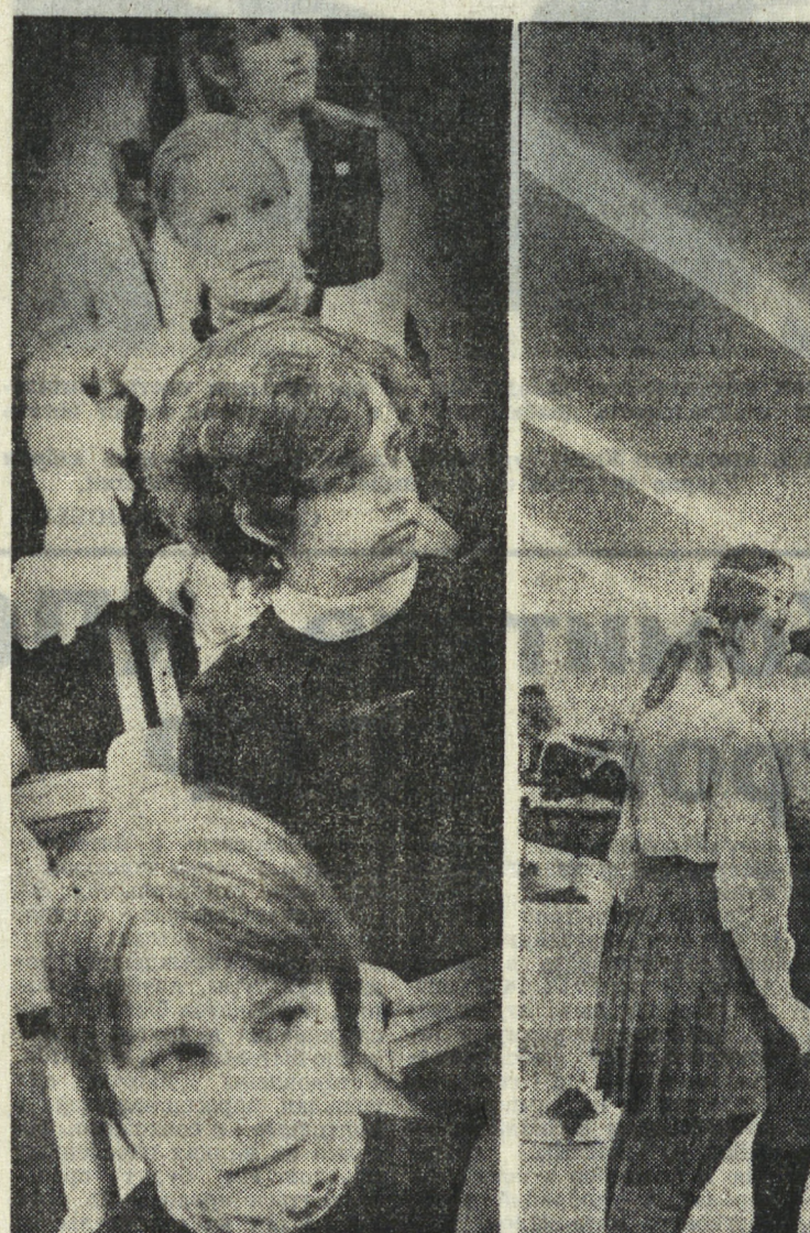
На этих снимках, сделанных нашим корреспондентом Л. БАРАНОВЫМ, — участники I областного слета отличников учебы. Выявляют слабые стороны своих товарищей; и во время перерыва есть о чем поговорить с новыми знакомыми.

Удивительно богата и прекрасна природа Урала. Природа — это лес, воздух, птицы... И все это нуждается в нашей помощи, заботе, внимании. Наше школьное лесничество «Кленовый лист» существует с 1967 года. Здесь мы не только учимся видеть природу, беречь ее, но и приобретаем опыт общественной работы, готовимся к поступлению в самостоятельную жизнь, стремимся внести свой вклад в дело охраны природы. Третий год я возглавляю наше лесничество, являюсь главным лесничим. Мне по душе комсомольское поручение, и к его выполнению я подхожу очень серьезно. Руководит работой штаб лесничества. В него входят: главный лесничий, два зоолога, три техника, из нашей школы, от отличников учебы, активисты. Наш штаб заседает раз в месяц. И когда собираются все члены штаба со своими планами, отчетами о проделанной работе, на заседаниях бывает «жарко». Никто из нас не должен оставаться равнодушным к такому важному делу, как охрана природы. Разговор на заседаниях идет серьезный — о графике работ, о качестве посадки леса. А посаженными ребятами не только являются все члены штаба и члены пионерской дружины, но и пионеры, учащиеся школы № 3 г. Кушвы.