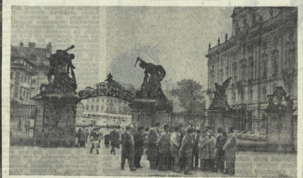
Из дальних странствий возвратись...