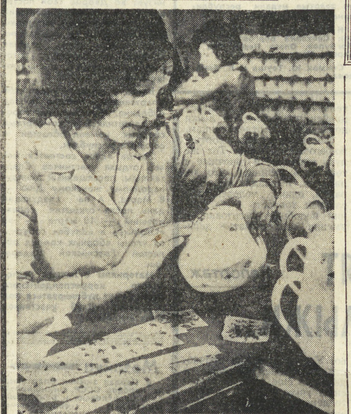
Давняя традиция, передаваемая из поколения в поколение опыт и модернизация производств позволили Чехословакии стать одним из главных поставщиков фарфора на мировом рынке.