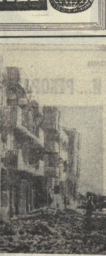
Занесенные песком долины, заброшенные дома, засохшие деревья — так выглядят сейчас северные районы Судана, пострадавшие от засухи.