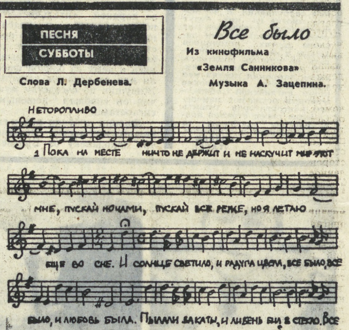
Слова Л. Дербенева. Музыка А. Зацепина.

Одна из главных причин неудачи спектакля — его неинтересное и неверное, на наш взгляд, изобразительное решение. Прежде всего, оно — что-то вторично. Скажем, некоторые куклы (Фей, например), декорации явно навеяны иллюстрациями Б. Свешникова.