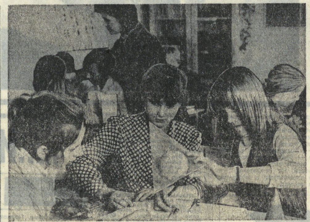
В нынешнем году впервые в Польше открылись объединенные школы в сельской местности. Смысл этого нововведения заключается в ликвидации мелких деревенских школ и создании на их базе учебных заведений с восьмилетней программой обучения...