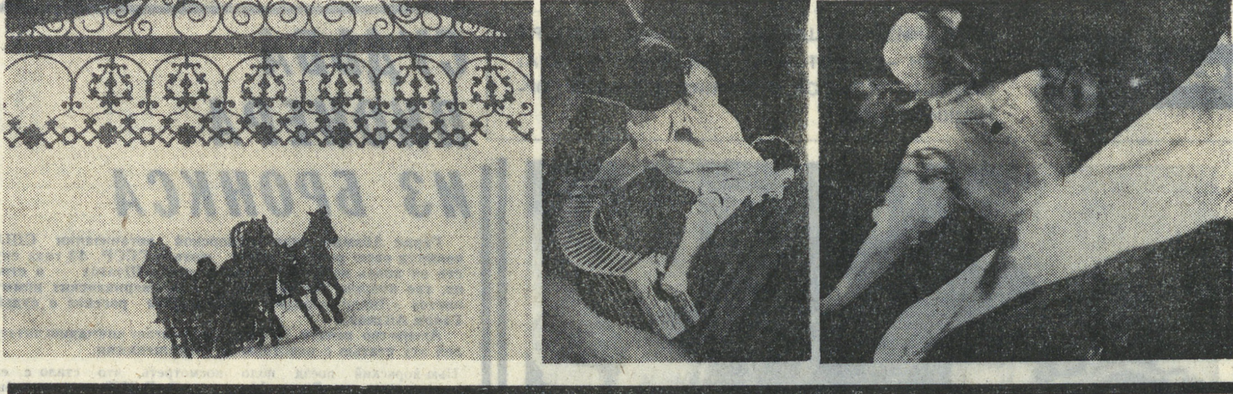
ФОТО. НОВЕЛЛА КАК ЗИМУ ПРОВОЖАЮТ? Да так же, как и встречают ее испокон веков на земле нашей...

ДОБРЫЙ ДЕНЬ, УРАЛЬЦЫ! ВЕЧЕР «Как ты читаешь?»