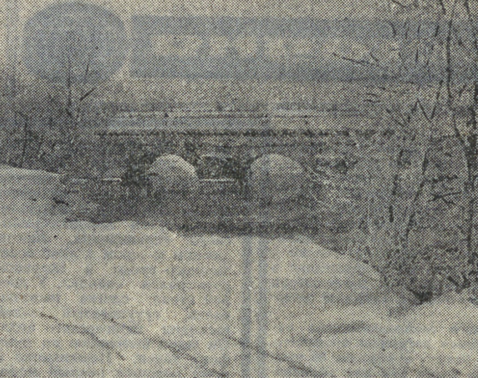
ФЕВРАЛЬ Снимок М. ТУБМАНА.