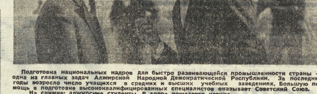
Подготовка национальных кадров для быстро развивающейся промышленности страны — одна из главных задач Аджирской Народной Демократической Республики. За последние годы возросло число учащихся в средних и высших учебных заведениях. Большую помощь в подготовке высококвалифицированных специалистов оказывает Советский Союз. На снимке: алжирские студенты. В споре рождается истина.

«Требуем решительно окончить с инфляцией», «Добьемся значительного повышения заработной платы», «Весеннее наступление рабочих в 1974 году будет победоносным». Под эти лозунги в конце января в токийском парке Мэйдзи состоялся массовый митинг трудящихся, созванный объединенным комитетом по проведению весенней борьбы 1974 года. Обращаясь к 56 тысячам участников митинга, председатель Генерального со-