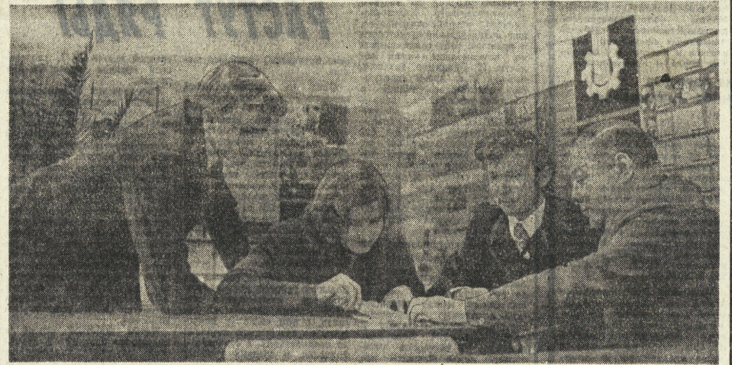
ЛАТИВИЙСКАЯ ССР. Около 12 тысяч специалистов сельского хозяйства подготовил Прекулесское сельское профессионально-техническое училище № 2. Сейчас здесь занимаются 540 юношей и девушек из совхозов и колхозов республики. В их распоряжении хорошо оборудованные мастерские и кабинеты, сельскохозяйственные машины. Выпускники вместе с дипломом механизатора получают аттестат о среднем образовании. Многообразна и интересна жизнь воспитанников училища.