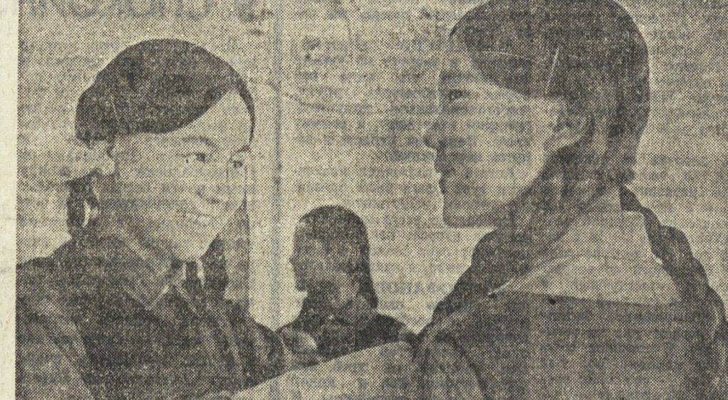
В Монгольской Народной Республике ведется большая работа по подготовке национальных кадров для различных отраслей народного хозяйства страны. В настоящее время в стране имеется более 20 профессионально-технических училищ, где юноши и девушки овладевают 70 различными специальностями. В развитии системы профтехобразования и в подготовке квалифицированных рабочих большую помощь оказывает Советский Союз. На снимке: в общинности ПТУ Центрального аймака.