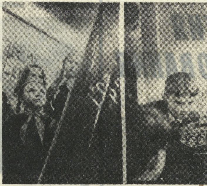
В музее истории комсомольской и пионерской организации области