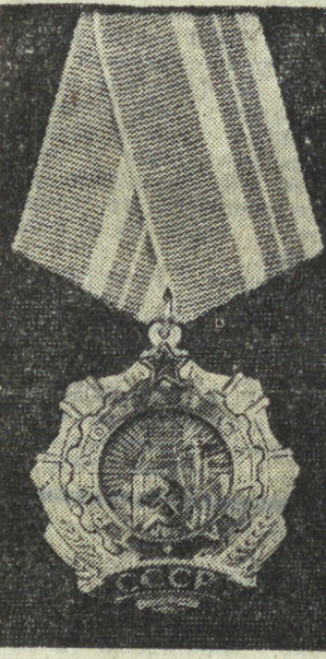
Орден Трудовой Славы II степени