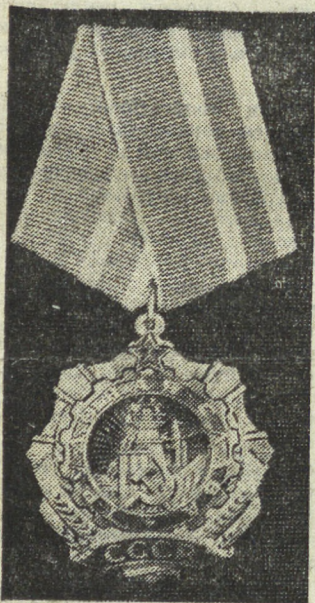
Орден Трудовой Славы I степени