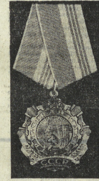
Орден Трудовой Славы III степени