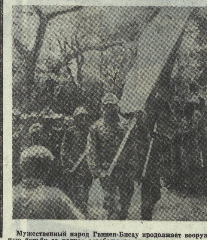
Мужественный народ Гвиней-Бисау продолжает вооруженную борьбу за полное освобождение территории страны от португальских колонизаторов. В освобожденных районах развертывается строительство новой жизни: действуют народные органы власти, открылись школы и больницы, налажено снабжение населения продовольствием и товарами первой необходимости. На снимке: во время парада боевых отрядов в освобожденной части страны.

В Арабской Республике Египет в торжественной обстановке сдана в эксплуатацию третья домна Хелванского металлургического комбината, и тем самым практически завершены работы по первой очереди расширения и реконструкции комплекса, сооружаемого при экономической и технической помощи Советского Союза. С пуска третьей домны завод будет выплавлять почти миллион тонн стали в год. На снимке: группа египетских специалистов-строителей третьей домны Хелванского металлургического комбината.