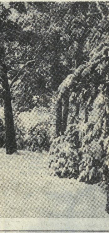
Синица В. ШУМКОВА.

Услуги ПСЫЛТОРГА. База Псылторга в Аптеке под Москвой, специализирующаяся на рассылке грампластинок.