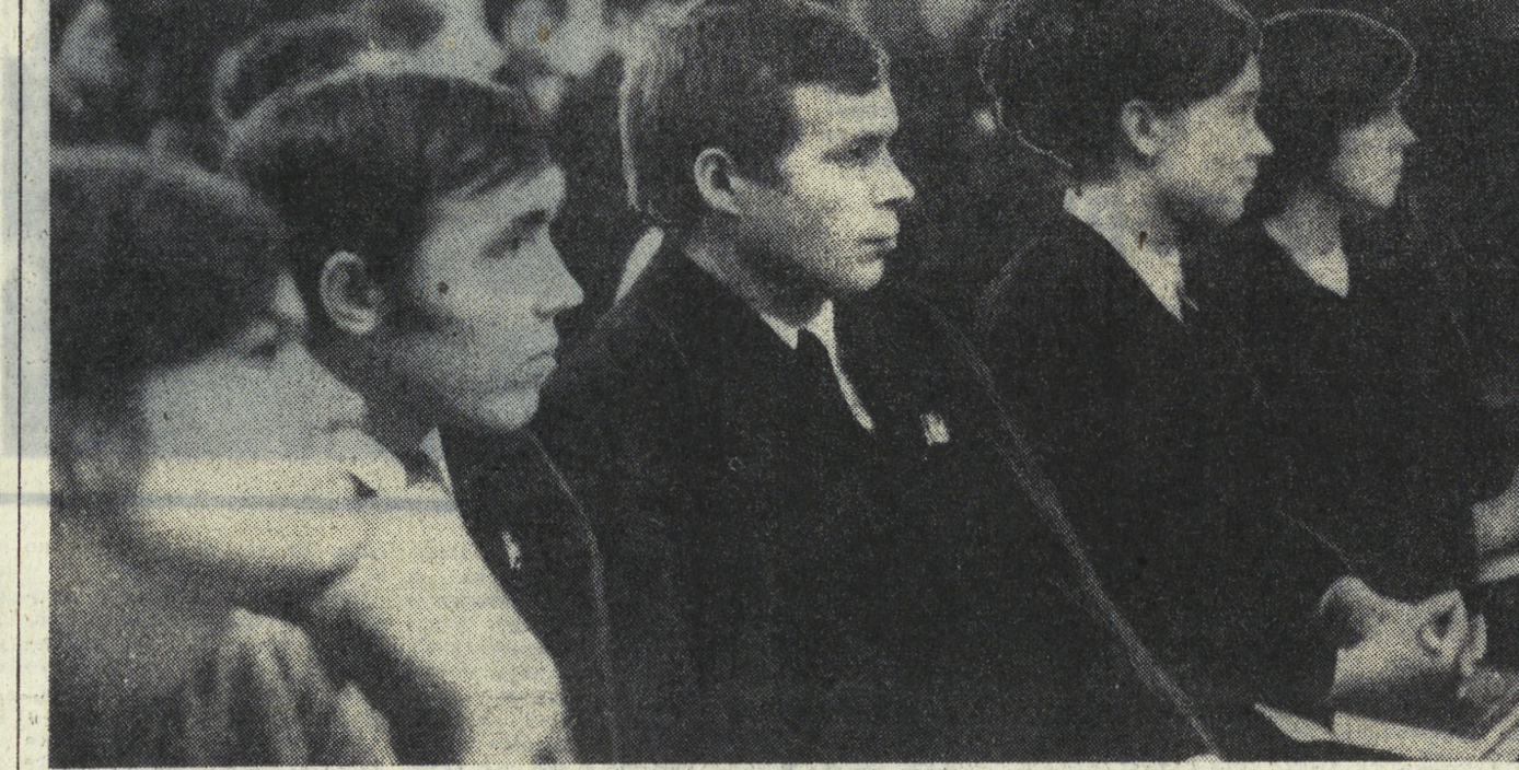
На снимке А. Лыскова: молодые депутаты в зале заседаний.