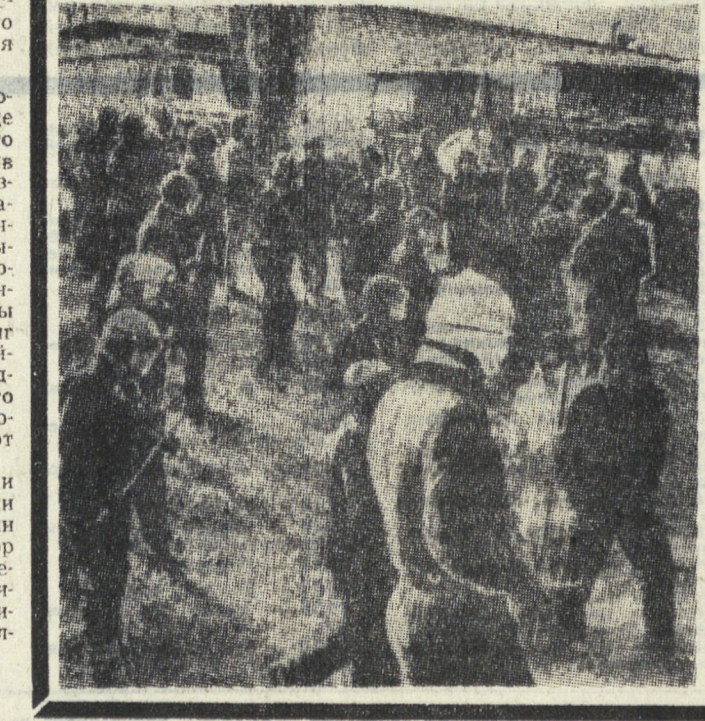
США. Последствия энергетического кризиса в Соединенных Штатах уже испытывают на себе работники автогоспорта. В эти дни по всей стране нарастает стихийная кампания протеста водителей грузовиков, поскольку рост цен на горючее и снижение скорости на дорогах болезненно ударяют по их заработкам. В разных штатах страны тысячи людей прекратили работу, блокируя дороги и подъезды к заправочным станциям. НА СНИМКЕ: полицияне разгоняют водителей грузовиков, которые блокировали одну из застав в штате Огайо.