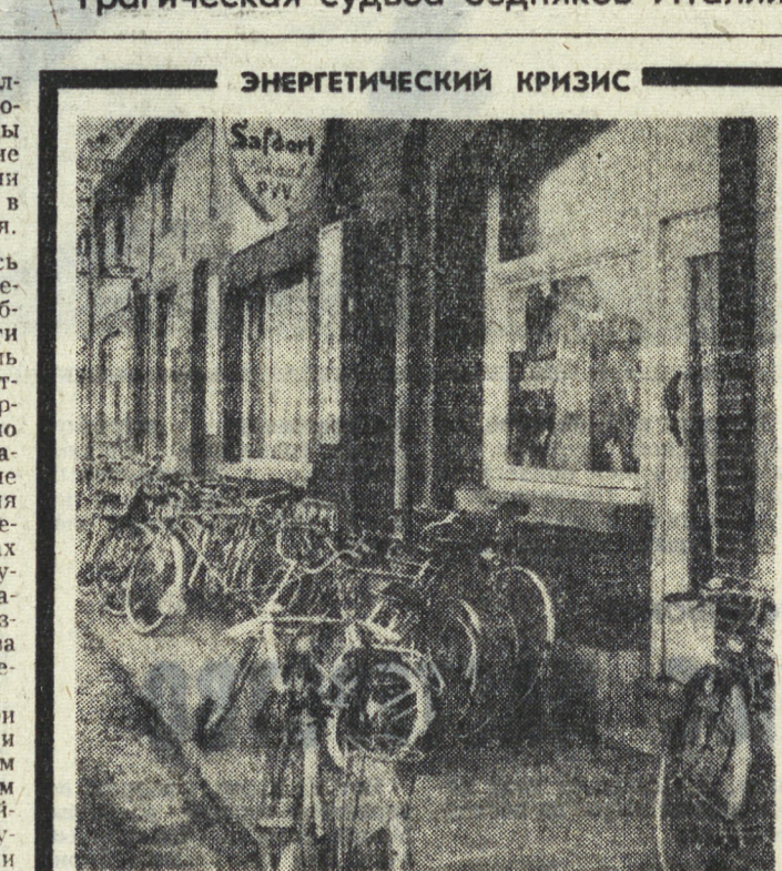
Положение с индийским топливом в Бельгии резко ухудшилось. Сократился объем работ на нефтеперерабатывающих заводах. Строго ограничивается время работы бензозаправочных станций. Повсеместно на территории страны сокращается освещение улиц, шоссе и дорог. Запрещено автомобильное движение по субботам и воскресеньям. НА СНИМКЕ: на улицах Брюсселя с каждым днем увеличивается количество велосипедов. Бельгия — ТАСС.

«Педагогический цех» Острова Свободы Гнусный фарс чилийской хунты Трагическая судьба бедняков Италии