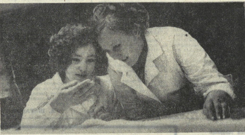
Комсомольская организация цеха полиамидных смол Свердловского завода пластмасс — одна из немногих в области по предпринятию. Однако комсомольцы цеха могут раскрасить много хорошего...

«Мы призываем каждого комсомольца области, — говорит в обращении, — принять на себя конкретные обязательства, вовлечь в социалистическое соревнование всех труженников села».