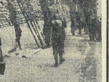
Можайск, Калинин, 16 октября часть правительственных учреждений и дипломатический корпус были эвакуированы из Москвы в Куйбышев.