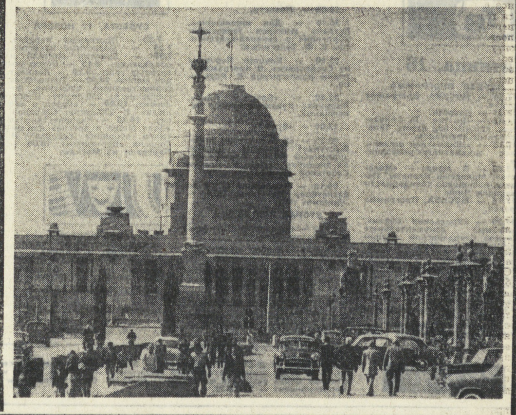
Планета в объективе