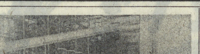
Стройка «Тушимце-2» — международная молодежная стройка.

На севере Чехии строится электростанция «Тушимце-2», шефство над которой взял Социалистический союз молодежи Чехословакии. Вот уже третий год на помощь чехословацким строителям приезжают бригады добровольцев — молодые специалисты из Советского Союза, Болгарии, Венгрии, ГДР и Польши.