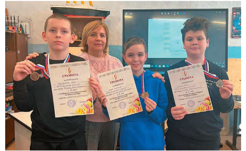
Бисертские медалисты с педагогом на соревнованиях в Сысерти

Соревнования проходили в два этапа: на первом нужно было осуществить сборку и программирование робота; на втором этапе собранный и запрограм-