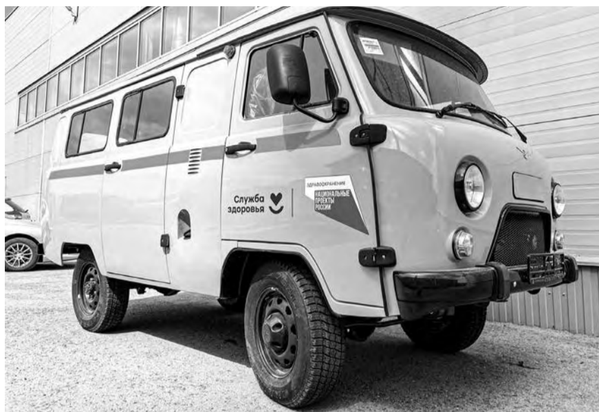
На новых УАЗах написано «Служба здоровья» и «Нацпроект «Здравоохранение»

31 января в Екатеринбурге прошла торжественная церемония вручения ключей от новых автомобилей медицинским учреждениям региона. 41 машина марок «Лада Гранта», «Лада Нива» и УАЗ были закуплены в рамках региональной программы «Модернизация первичного звена здравоохранения Свердловской области». Транспорт получили в общей сложности 35 больниц, в том числе Ирбитская ЦГБ.