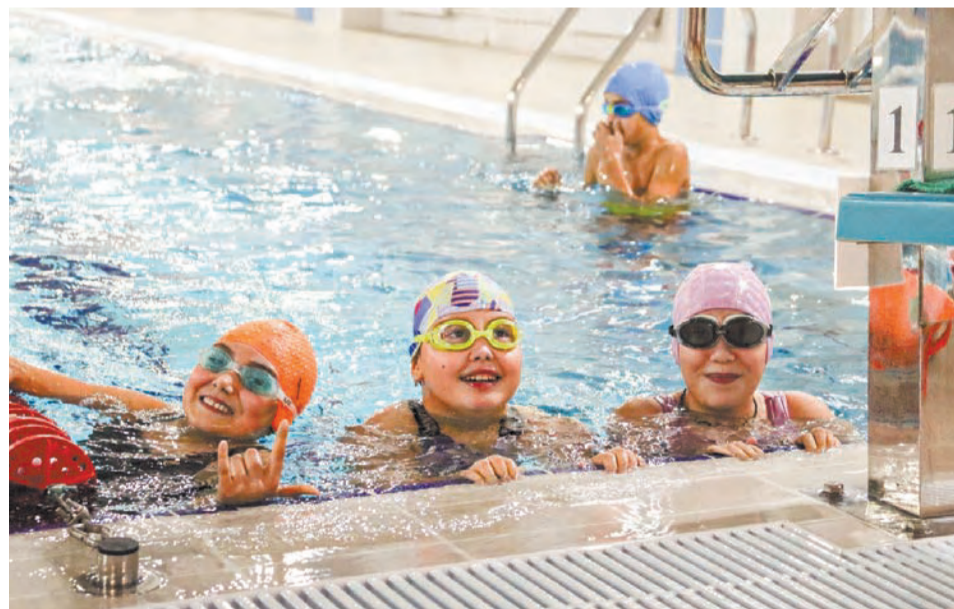
В 25-метровом бассейне регулярно занимаются плаванием не только взрослые, но и дети