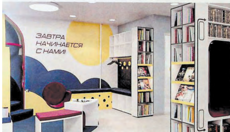
Так будет выглядеть зона выдачи детских книг после обновления библиотеки

Торжественное открытие запланировано на конец сентября этого года. Уверена, что посетители тоже будут в восторге, когда оценят перемены.