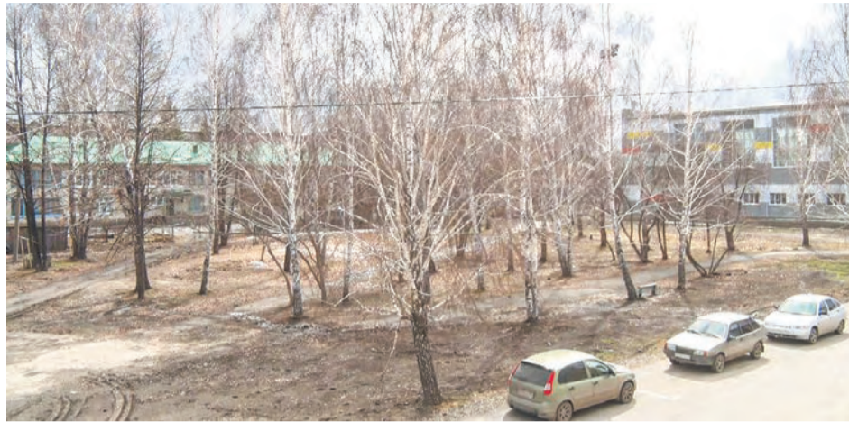
Березовую рощу у стадиона «Юность» будут благоустраивать в этом году, за нее проголосовало большинство ирбитчан