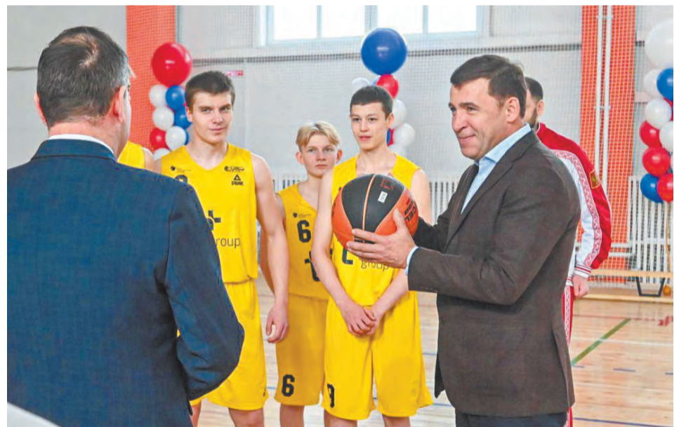
В марте 2023 года Евгений Куйвашев, открывая ФОК «Олимпиец», подписал мяч местной баскетбольной команде

Во втором здании ФОКа функционирует спортивный зал, где организованы оздоровительные и тренировочные занятия по мини-футболу, волейболу, баскетболу и общей физической подготовке. Активно работает секция детского футбола для детей Ирбита и Ирбитского района в возрасте 5–7 лет.