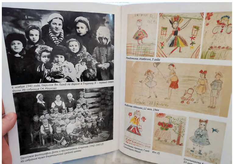
Новую выставку сопроводил каталог «Сибирский след» с работами и воспоминаниями эвакуированных.