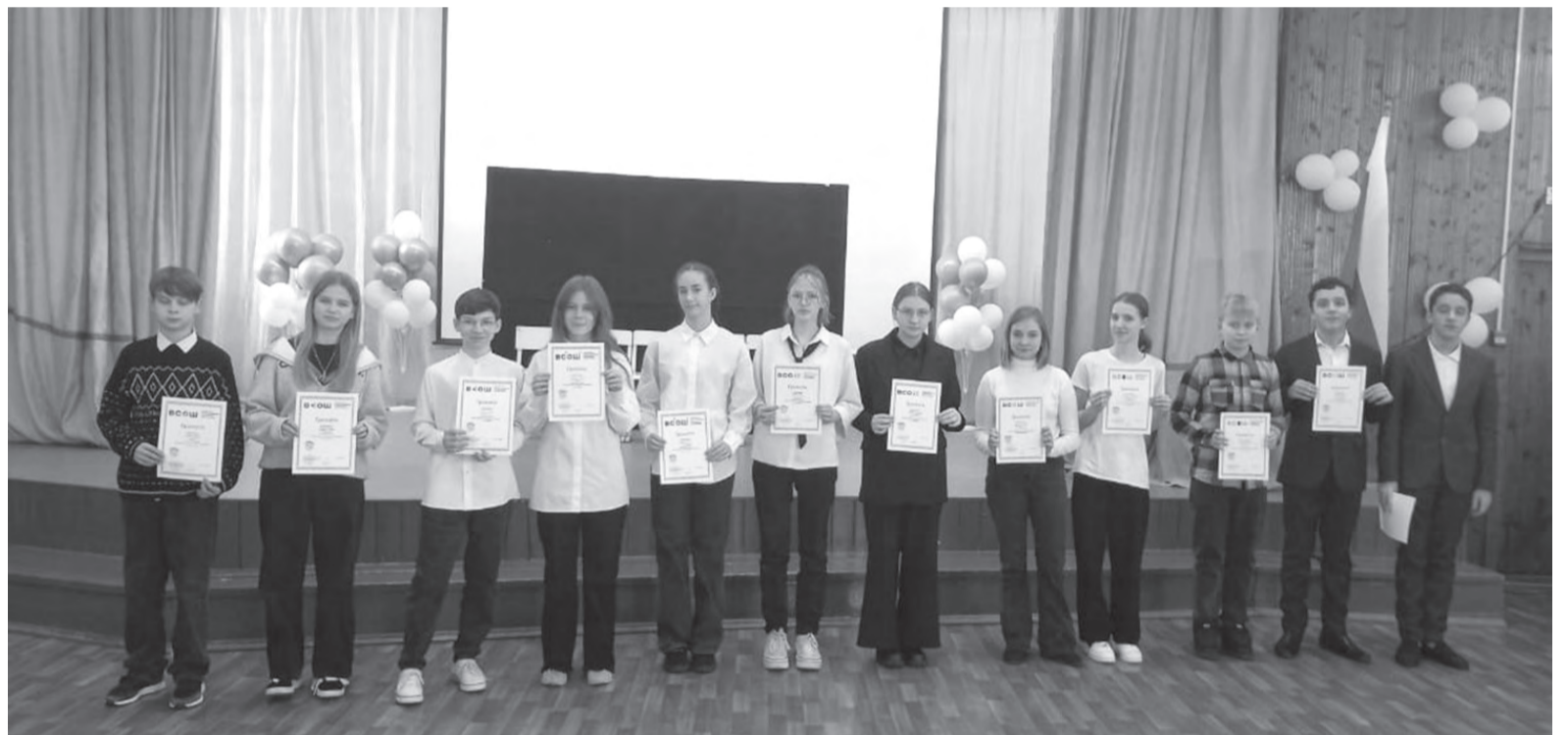
Участники муниципального этапа ВсОШ