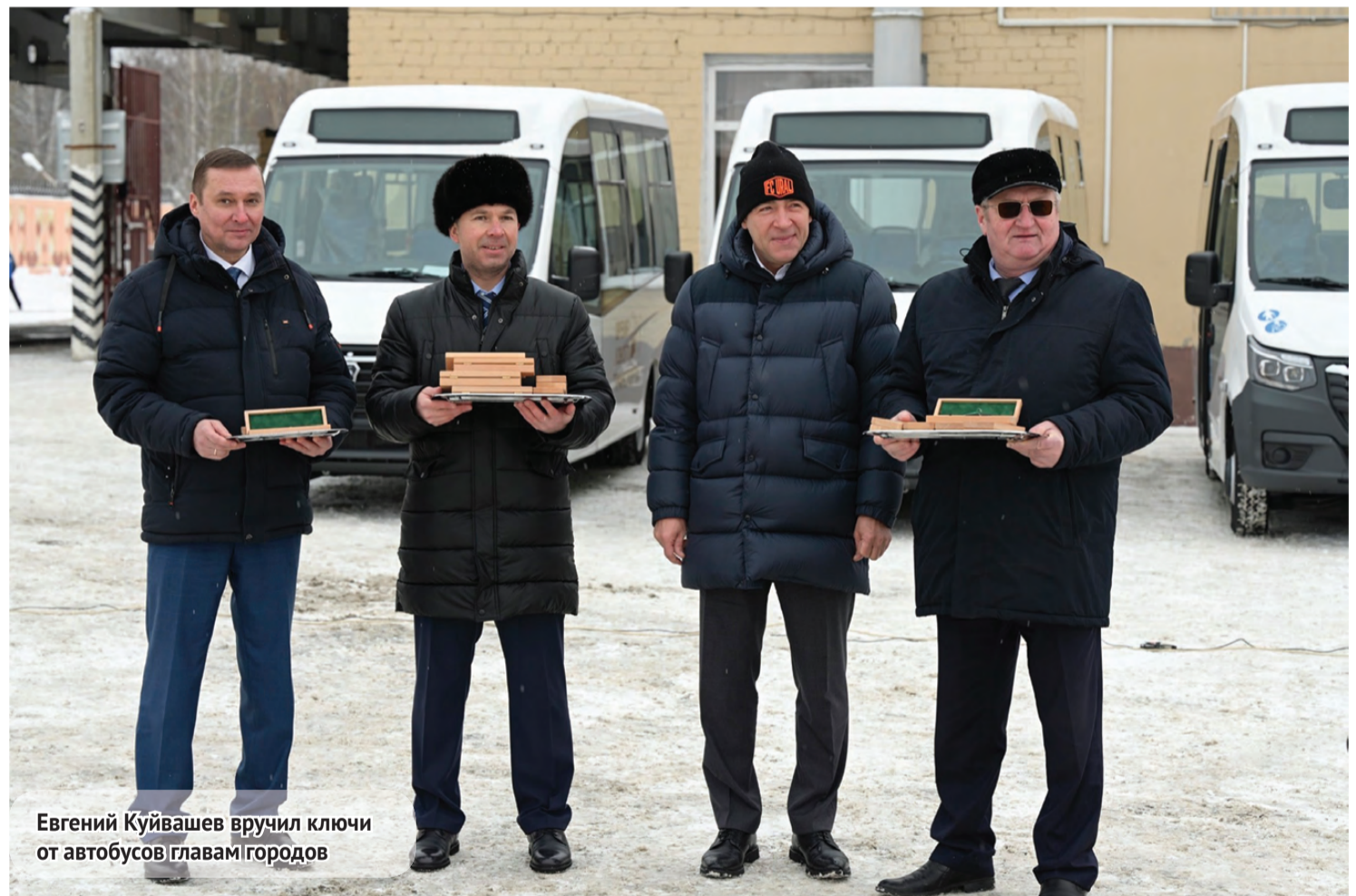
Евгений Куйвашев вручил ключи от автобусов главам городов