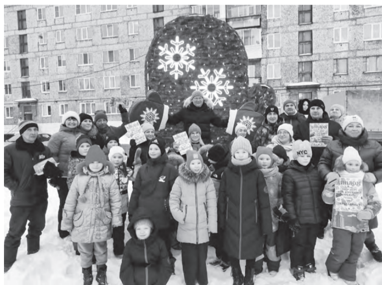
Жители и гости пос. Пригородного на семейном празднике

2 февраля во дворе многоквартирного дома по ул. 40 лет Октября, 7 было многолюдно. Такого скопления народа поселок Пригородный не видел давно. Здесь собрались и стар, и млад. В центре зимнего действа – арт-объект в виде огромной варежки, рядом – выставка всевозможных рукавичек, авторами которых стали воспитанники детских садов № 16 и 26, здесь же – Баба-яга, в окружении которой веселились взрослые и дети, на столе – горячий чай с сухарями и крендельками, а вокруг – смех, музыка, игры, конкурсы. И конечно, подарки. Так красно-