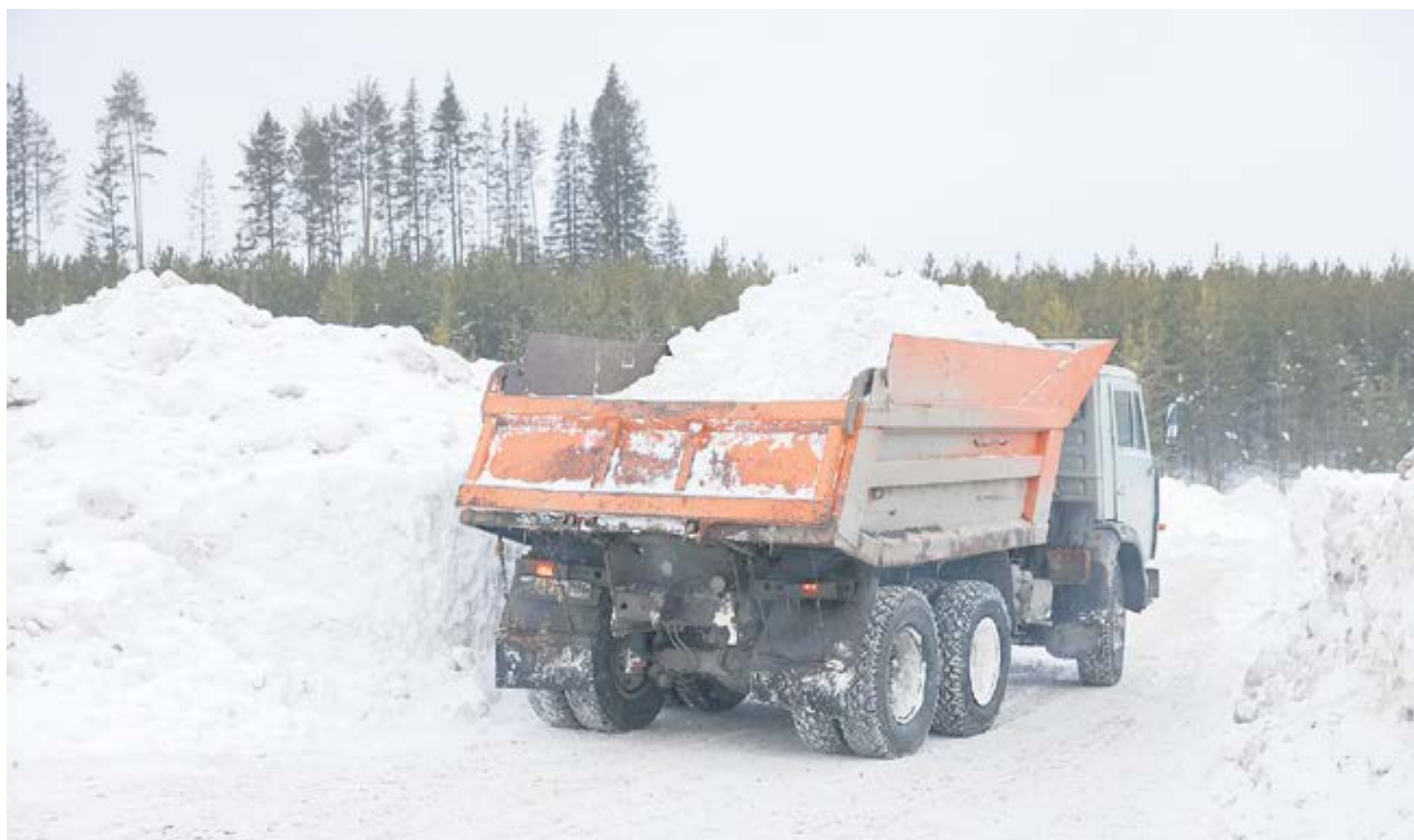
Сегодня на снегоприемном пункте вот так — кучи намного превышают человеческий рост. И до окончания зимнего периода еще два с половиной месяца.