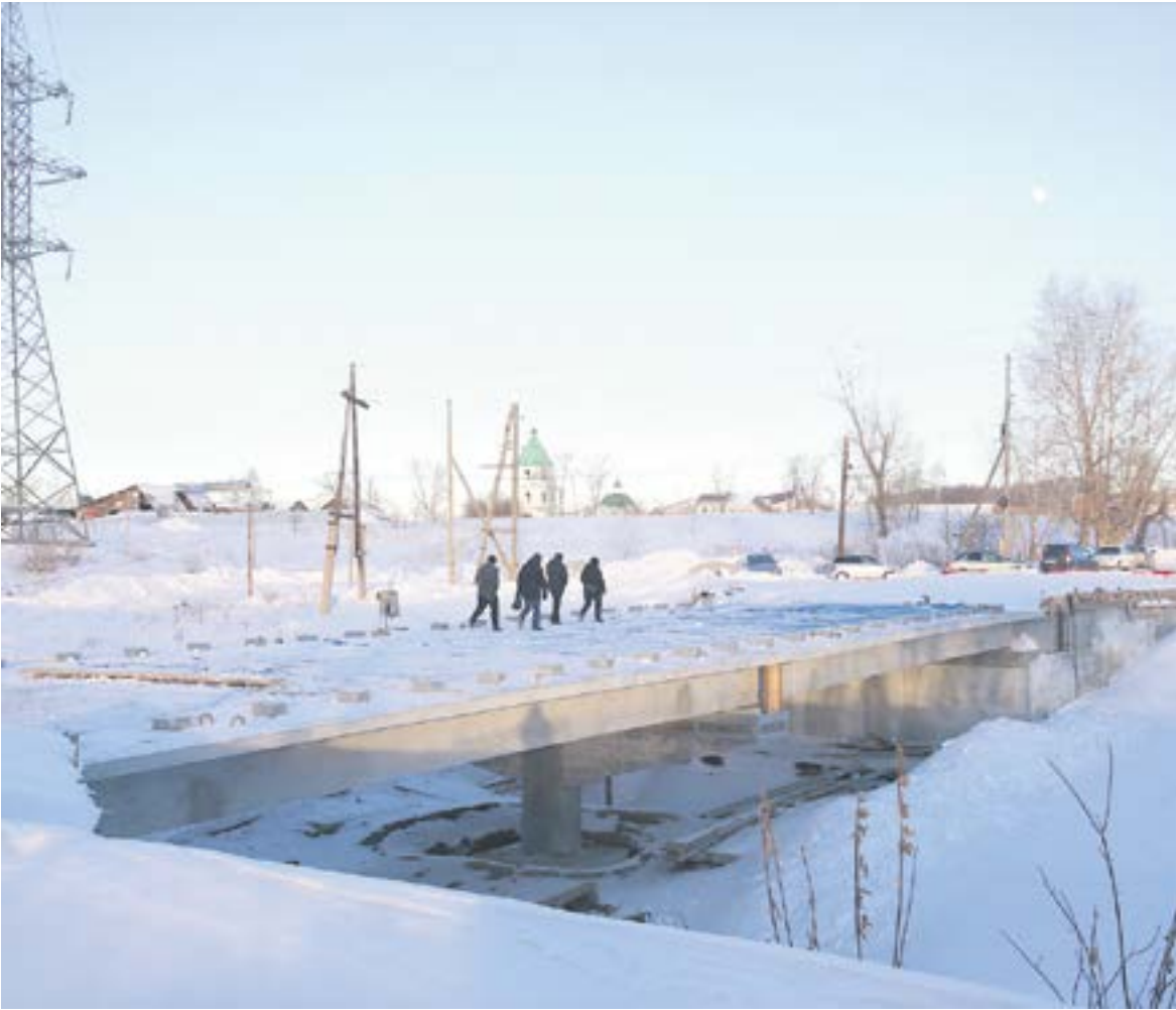
Шараминский мост уже почти готов, но еще не открыт. Хотя по нему уже ходят люди. // Фото Владимира Кочубы-Белых