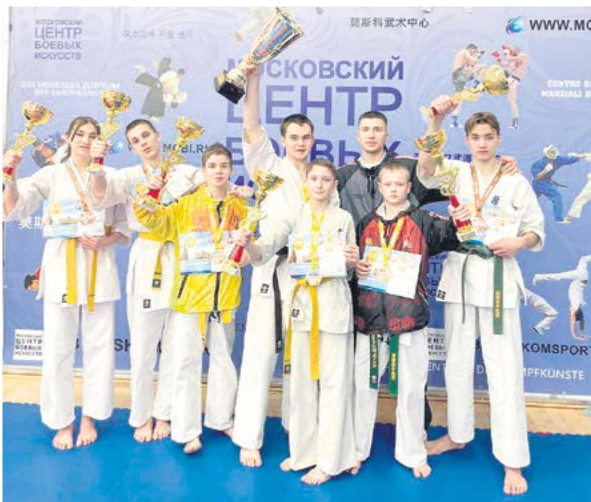
Все ревдинцы-победители московского турнира.

Желающие тренироваться, побеждать и быть сильными духом и телом, приходите в центр Киокусинкай, на Ярославского 9а. Телефон для записи: 8 (905) 803-18-58.