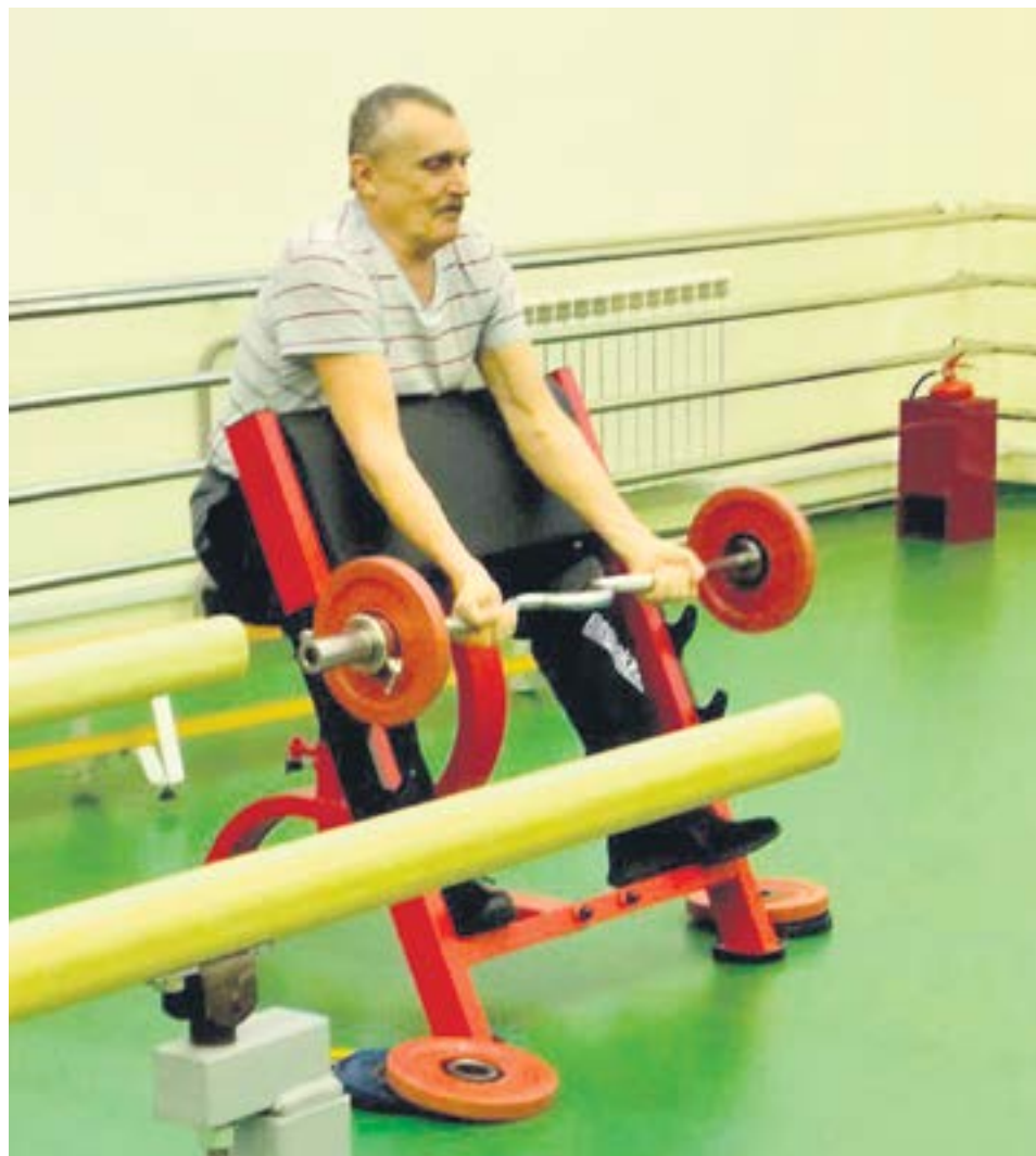
На сложных тренажерах работают мужчины.

В зале занималось 15 человек, и все с удовольствием под легкую музыку осваивали спортивные снаряды, общались с инструктором и с друзьями. Получился у кирзаводчан настоящий клуб по интересам, приносящий огромную пользу. Хочется пожелать этой дружной компании крепкого здоровья, оптимизма, быть примером для подрастающего поколения, приобщать к занятиям физкультурой своих внуков, друзей и родных.