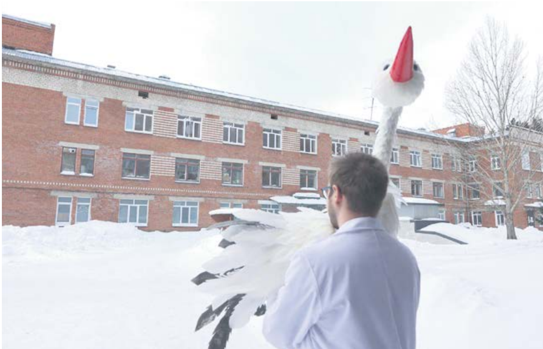
Женская консультация находится сейчас в фазе глобального переезда, но на этой неделе с этим должны закончить.

— На втором этаже планируется также модернизация системы помощи онкобольным пациентам. Чтобы человеку, пришедшему на прием к онкологу, тут же была доступна и химиотерапия. Сейчас дневной стационар по химиотерапии находится на Энгельса, 48. А хотелось бы, чтобы все было максимально комфортно для людей, и находилось в одном месте.