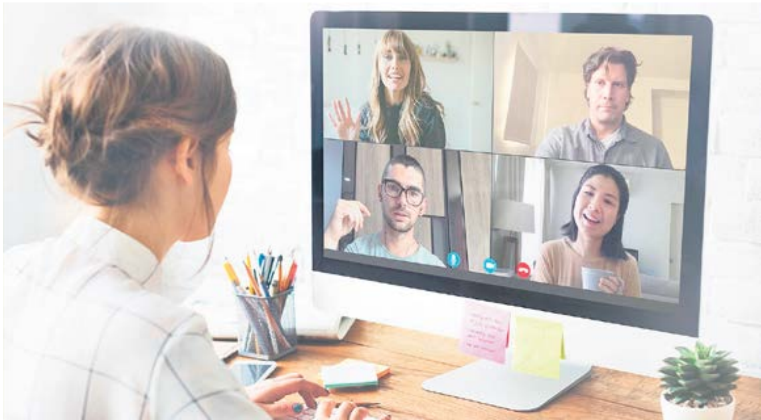
Встречи проводятся в онлайн-формате, что делает их максимально удобными и безопасными для здоровья пациентов в моменты, когда их иммунитет ослаблен.

Сейчас в группе больше 100 участниц, которые могут общаться на онлайн-встречах в зуме или в общем чате в «Телеграме». Некоторые из них недавно начали проходить лечение и хотят поддержки, другие уже имеют опыт жизни с онкодиагнозом и готовы им поделиться. Ведущие отмечают: рядом с теми, кто прошёл похожий путь, легче раскрываться и ожидать, что тебя поймут, в результате участия в группе женщины больше не чувствуют себя изолированными, одинокими и непонятыми в связи с диагнозом.