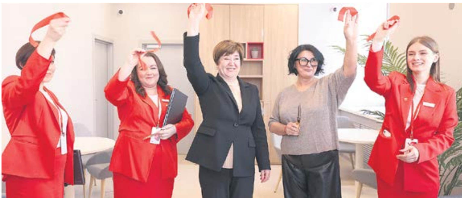
Официальное открытие отделения Альфа-Банка в Ревде случилось 24 января.

Ну, с Новым годом, Ревда, с новым банком! Приходите удивляться.