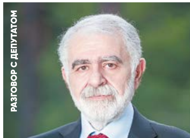
РАЗГОВОР С ДЕПУТАТОМ

— У нас очень большая проблема с жителями, которые оставляют свои машины, и ты не можешь почистить двор. Объявления, о том, что сегодня будут чистить, уже скоро на лоб будем вешать, толку никакого. На дорогах часто бывает то же самое, хотя подрядчики и выставляют аншлаги.