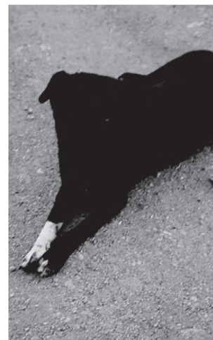
ЛАПКА. Хорошая, спокойная, умная, приучена к вольеру