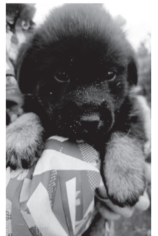
ЩЕНКИ. От крупной собаки, возраст 3 месяца