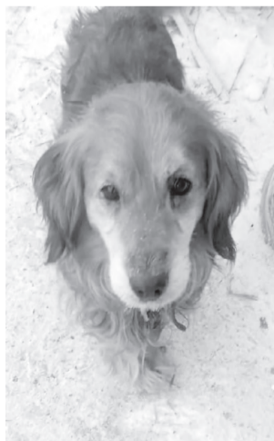
ЛУША. Спаниель, маленького роста, спокойная, приучена к вольеру

В городе Реж в пункте кратковременного содержания безнадзорных животных находятся собаки, готовые обрести дом и любящих хозяев. Все собаки прошли ветеринарный карантин. Животным поставлены необходимые прививки. Есть щенки, возраст от 1 месяца до года. Если Вы хотите обрести друга и надёжного охранника, звоните по телефону 8-912-674-23-28. Мы можем доставить вам понравившуюся собаку. Уважаемые режевляне, если у вас есть возможность помочь кормом для собак, то мы с радостью примем крупы (кроме перловой - ее собакам нельзя), макаронные изделия, кости, лапки кур, хлеб, сухари, сухой корм. Заранее огромное всем спасибо.