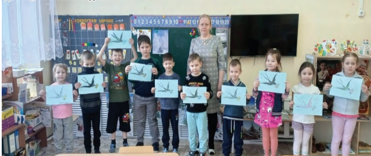
Дети подготовительной группы