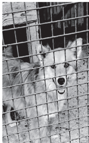
РЫЖИК. Небольшого роста, спокойный, приучен к вольеру