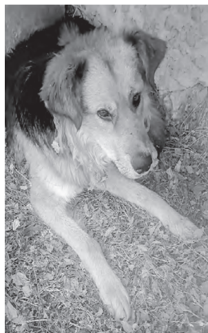
ШАРИК. Очень крупный, спокойный, послушный, приучен к вольеру