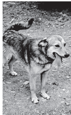
ЛЁНЯ. Хороший охранник, приучен к цепи и вольеру