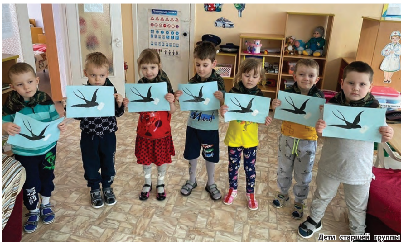
Дети старшей группы