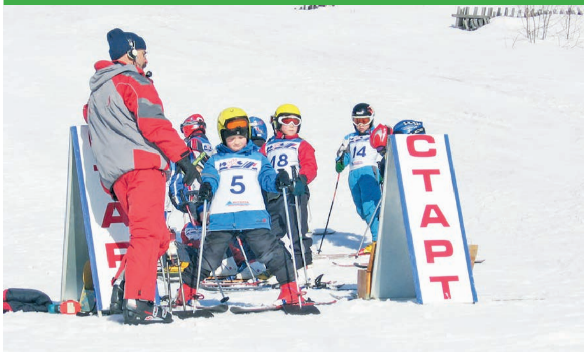
Соревнования на склоне Западного карьера. 2007 год

возможно из соображения безопасности на склоне.