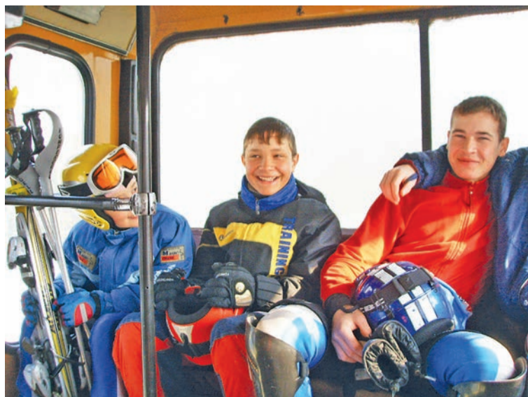
Воспитанники горнолыжной школы «РОУКС» в 2007 году

Если будут хорошие горнолыжные склоны, приедут тренеры, в разы увеличится количество детей в школе, что в настоящее время не-