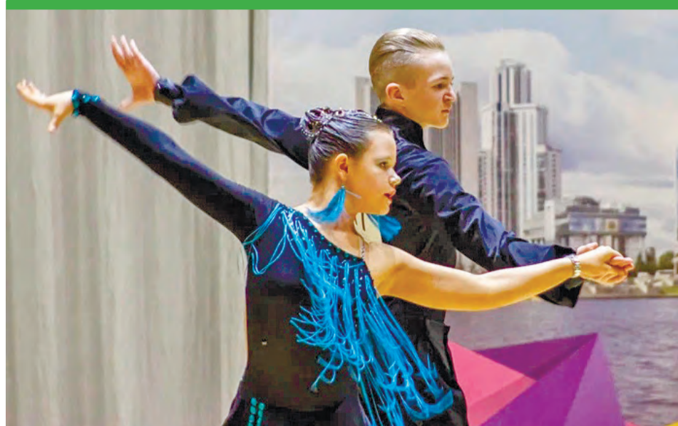
Фото ДК Качканара