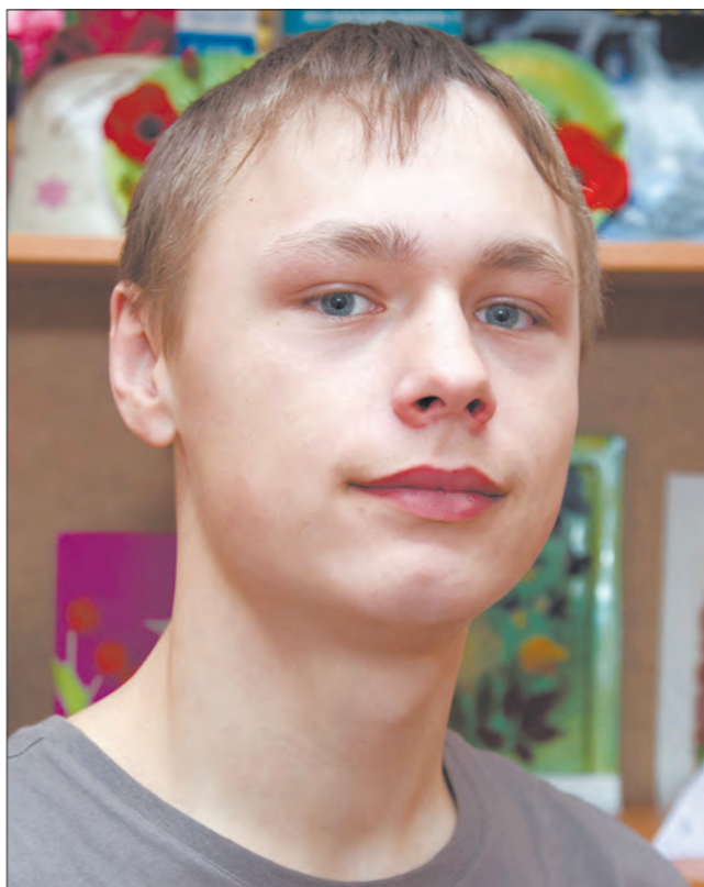
Сержа – неординарная личность.

Он проявляет интерес к литературе и компьютерной технике. В прошлом году мальчик участвовал в информационном конкурсе и занял первое место.