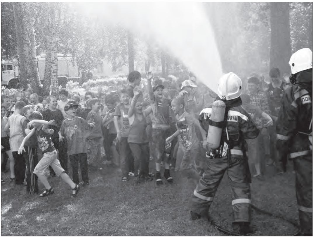
Бойцы пожарной охраны устроили для ребятни дождь.