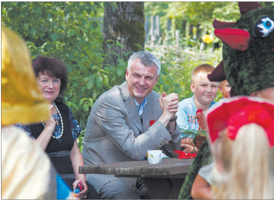
Гости искренне порадовались встрече с местными школьниками.