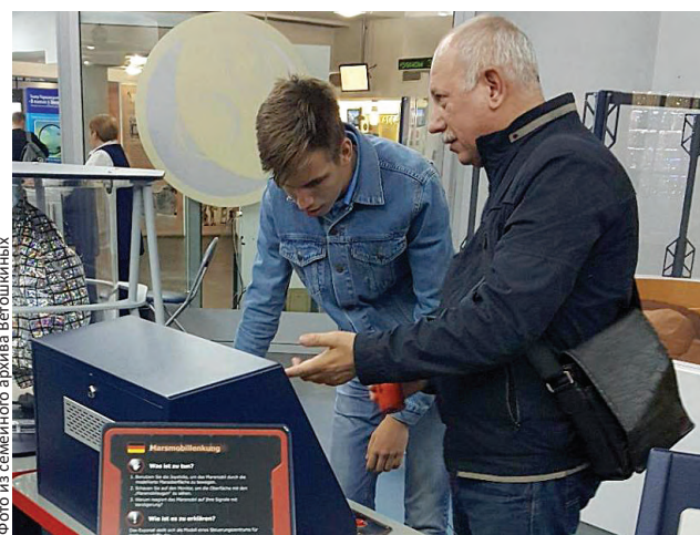
У сына с отцом всегда есть общие темы

– В целом общая профессия на отношения в семье влияет несильно, больше – характеры и взаимодействие людей между собой. Родители часто приходят из школы и