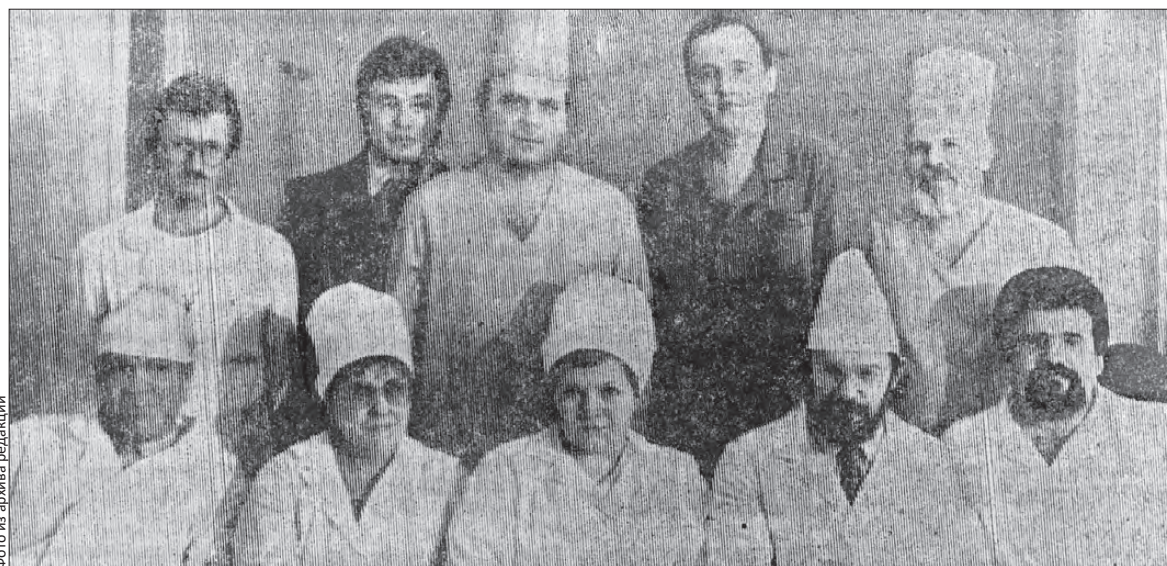
1990 год. Фото из номера «ПЗЛ», посвященного первоуральцам, которые спасали пострадавших