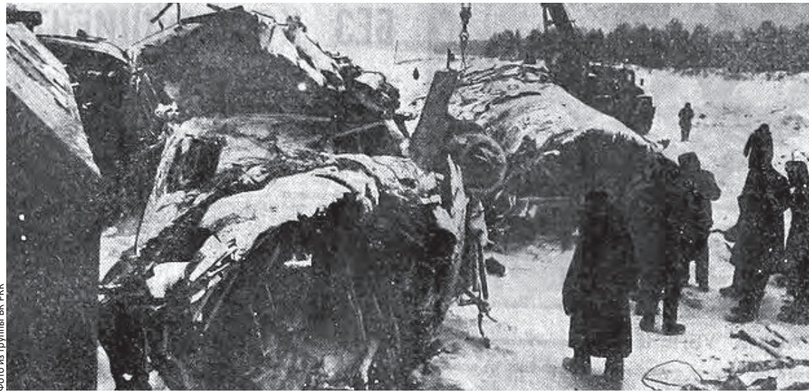
Кадр с места трагедии: самолет стал грудой металлолома