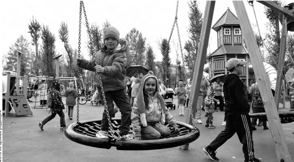
Программа по формированию комфортной городской среды продлена до 2030 года

Сегодня завершается первый этап голосования за территорию, которую благоустроят в 2025 году. По его итогам будут выбраны 5 из 18 объектов, предложенных для благоустройства первоуральцами.