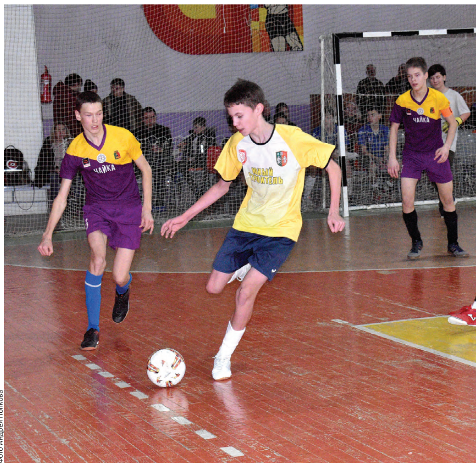
В атаке – «Юный строитель»