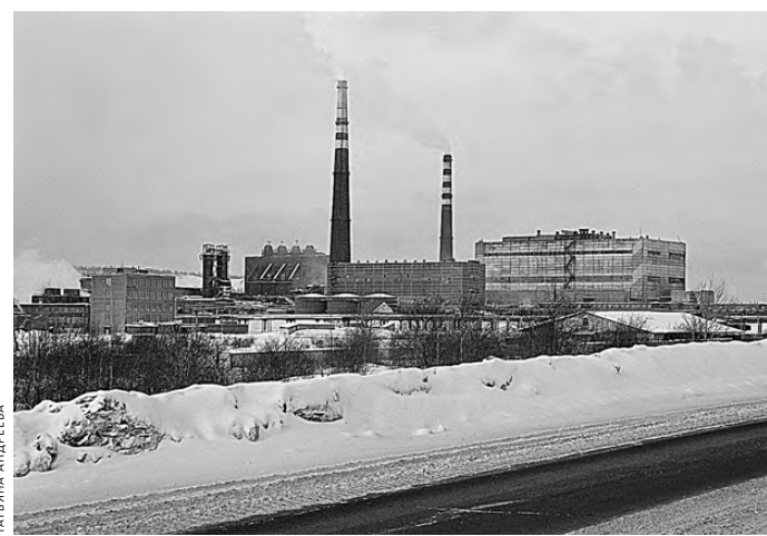
Почвы вокруг медеплавильного комбината сильно загрязнены, в этой зоне выживают не все растения.

почв медью. Кроме того, к подобному загрязнению приводит сельскохозяйственная деятельность — использование фунгицидов на основе этого элемента. Такая проблема актуальна, к примеру, для сельскохозяйственных почв Франции и Италии. ●