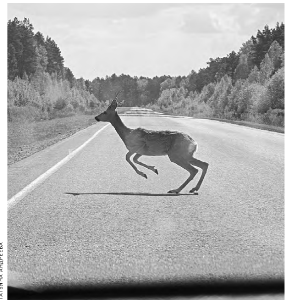
В местах миграции косуль водителям приходится быть очень внимательными.

Лесных красавиц в Зауралье спасают всем миром. Охотпользователи и общественные организации выкладывают для косуль корм, пробивают дороги вдоль трасс. В Шадринске активисты на собранные средства закупают и развозят по кормушкам сено, зерно, соль. По мнению одного из охотоведов, миграция косуль можно и нужно управлять, ее необходимо прогнозировать и готовиться к ней. В Зауралье накоплен такой опыт. Возможно, когда облупоуправление будет сформировано, эти вопросы займется основательно. ●