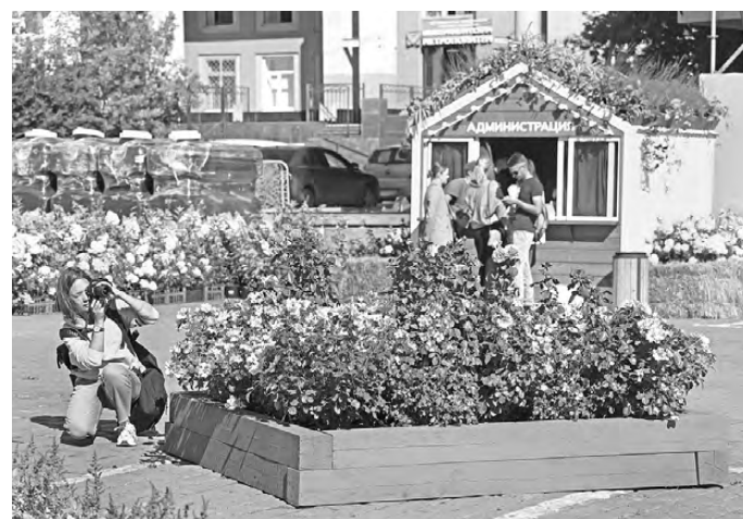
Растения, высаженные на площади 1905 года, к концу фестиваля чувствовали себя очень хорошо и могли не прижиться на новом месте.

Проект задуман с перспективой на семь лет. Курировать создание новой набережной будет специальное созданное архитектурно-ландшафтный совет. Ухаживать за растениями после окончания «Атмосфера» собираются сами организаторы фестиваля. В преобразовании участка они рассчитывают и на поддержку крупнейших девелоперов «УТМК-застройщик», «Брусника» и «Форум групп», чьи жилые комплексы расположены неподалеку. ●