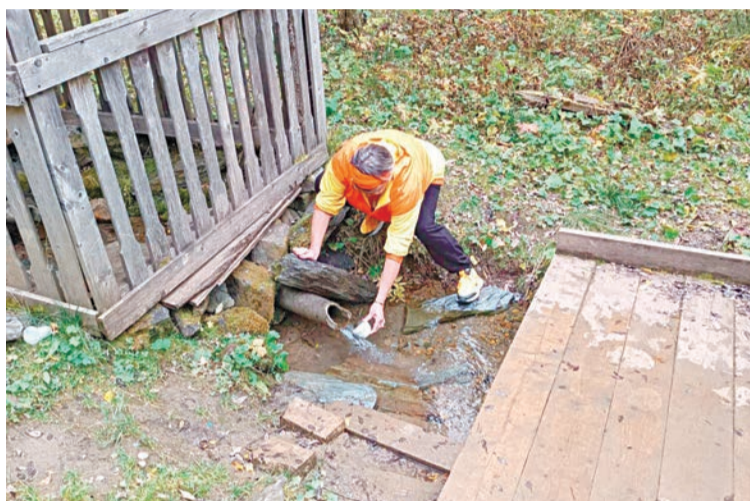
Спасибо роднику за алмазную водичку

Сейчас здесь леспромхоз. Увидели мы и сельскую школу, мемориал ветеранам Великой Отечественной