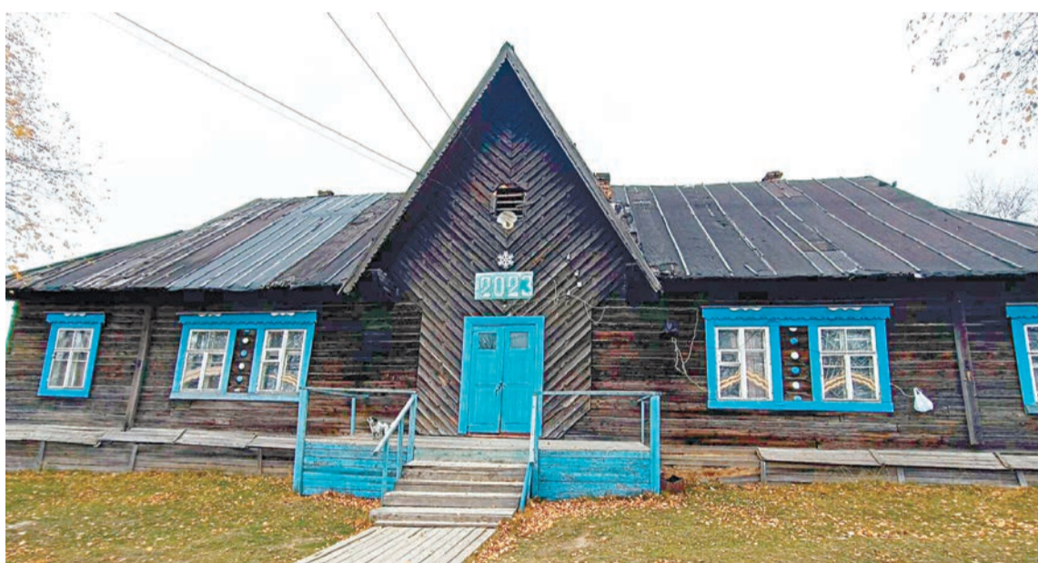
Вот такой в Медведке детский сад

Местный мужичок показал, где у них находится заброшенная алмазная фабрика. Начинаем двигаться