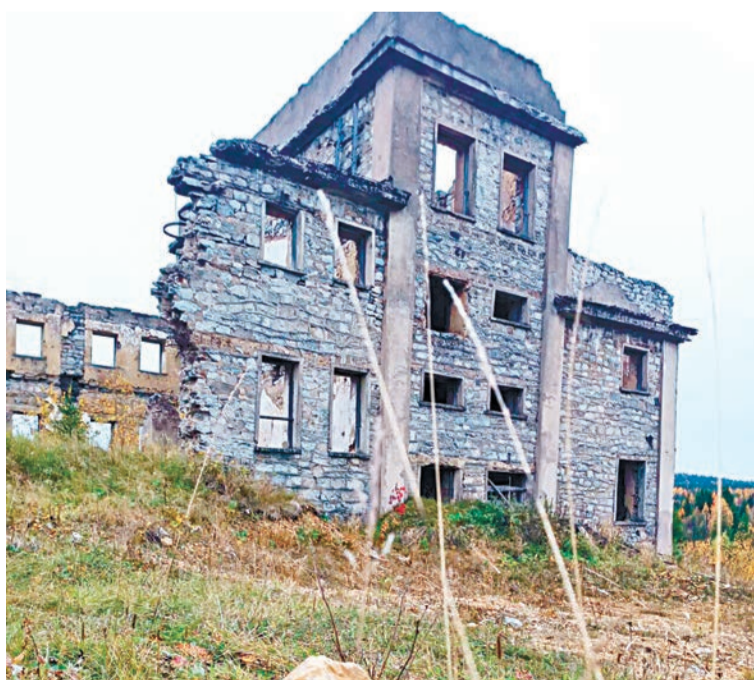
Развалины алмазной фабрики