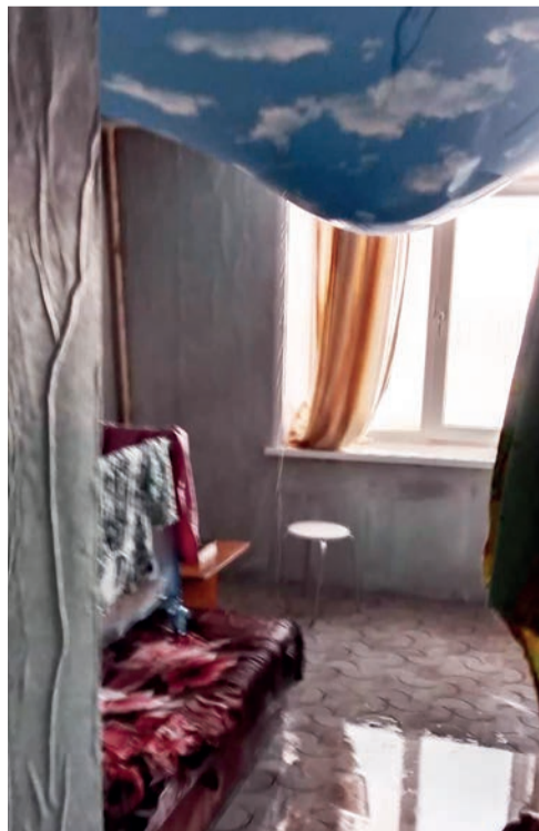
Последствия потопа видны только жителям, а не коммунальщикам