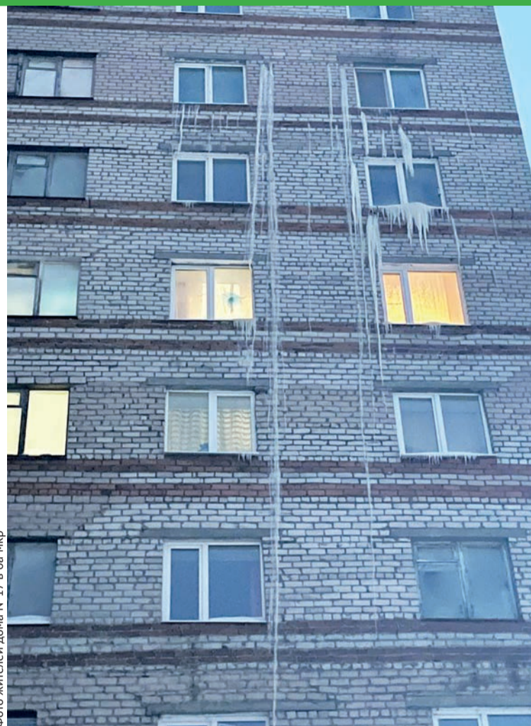
Фото жителей дома №17 в 6а мкр

И снова на дом выехали коммунальщики, которые и