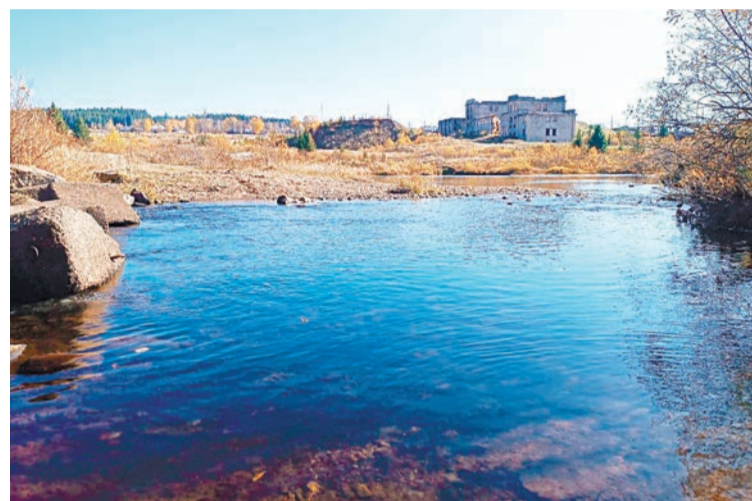
Река Койва, на берегу которой и расположилась Медведка

войны, отделения почты и Сбербанка, детский сад. Но, наверное, главная достопримечательность — это сельский магазин, где и в самом помещении, и на лавочке возле него сельчане ведут беседы, обмениваются новостями.