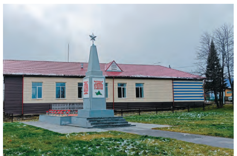
Воинский мемориал на улице Революции