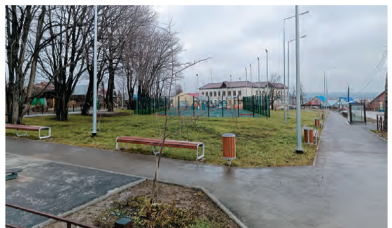
Сквер по улице Революции