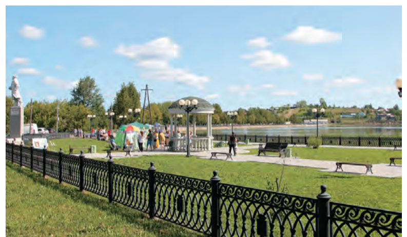
Набережная Бисертского пруда