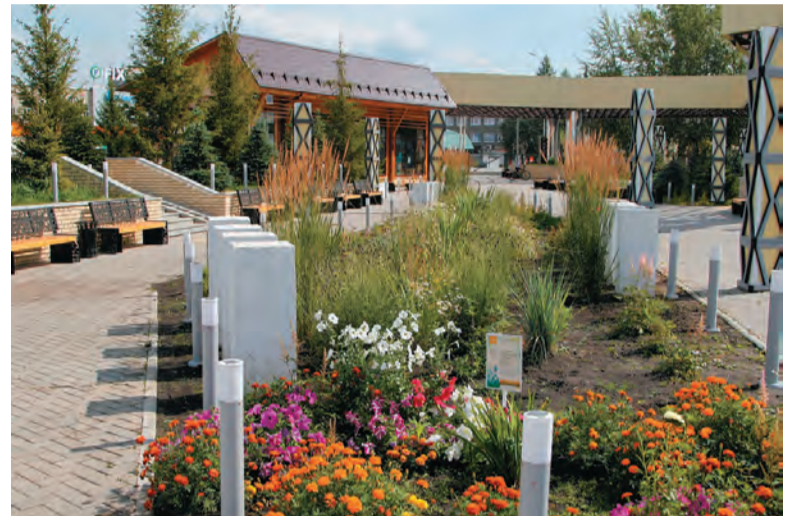
Сквер «Город мастеров» на месте разрушенного ДК ЛПХ

По этому президентскому национальному проекту в Бисертском городском округе за последние годы были благоустроены общественные территории