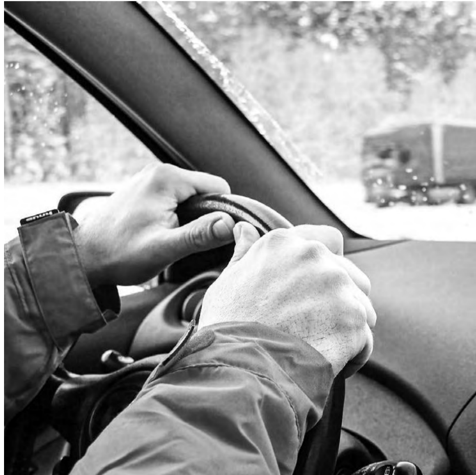
Профессиональный водитель автомобиля сейчас остается самой востребованной специальностью в Ирбите

Мы, журналисты, будучи в гуще событий, нередко слышим от ирбитчан: «В городе нет работы!». Как люди пытливые, мы решили проверить, так ли это на самом деле. И обратились к фактам, а именно к статистике городского Центра занятости. Выяснилось, что работа в Ирбите и Ирбитском районе есть – более 600 вакансий только в январе. На кого особый спрос и за какую зарплату – в нашем материале.