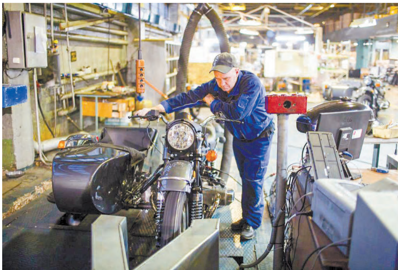
Ирбитские «Уралы» давно стали брендом Свердловской области, один из мотоциклов есть в личной коллекции президента России Владимира Путина

А также квартиры, автомобили и смартфоны. Это подарки жителям в честь 90-летия Свердловской области