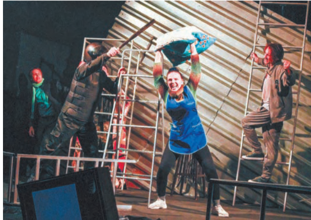
Одна из сцен нового спектакля «Угонщица»

26 января Ирбитский драматический театр покажет новый спектакль под названием «Угонщица». Как выяснил «Восход», билетов на премьеру практически не осталось. Судя по всему, ожидается аншлаг!