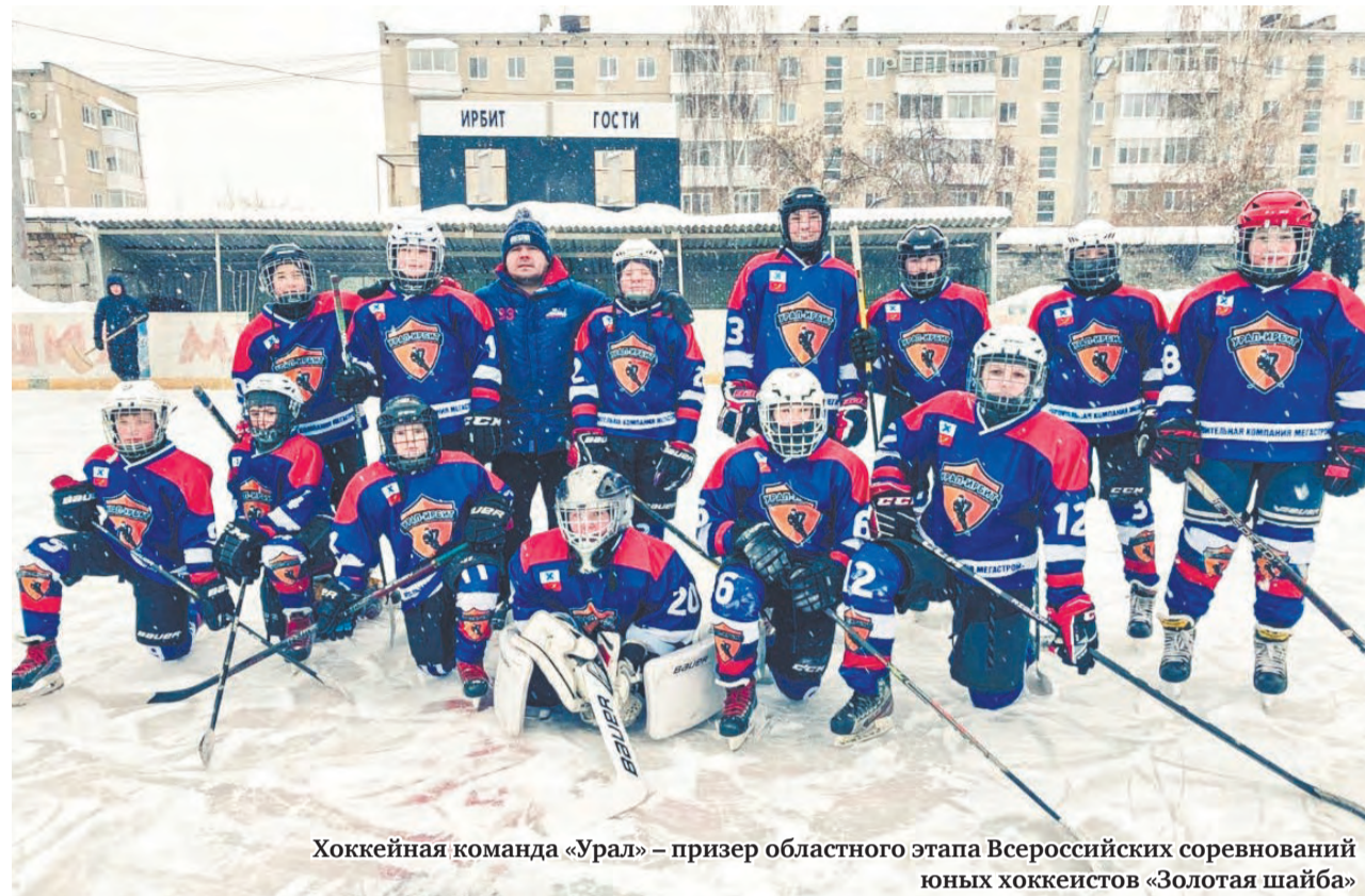
Хоккейная команда «Урал» – призер областного этапа Всероссийских соревнований юных хоккеистов «Золотая шайба»