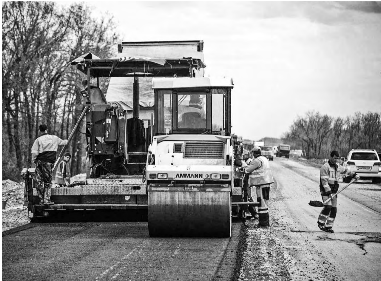
Бюджетные вложения в ремонт и содержание дорог в Ирбите сейчас составляют более 250 млн рублей ежегодно

Что ждет ирбитские дороги в наступившем году