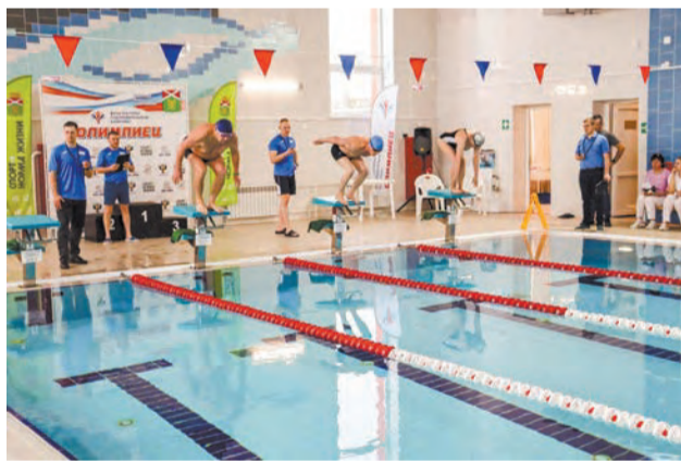
Заплывы на разные дистанции проходят в «Олимпийце» регулярно

20 января в физкультурно-оздоровительном комплексе «Олимпиец» в поселке Пионерском прошли открытые соревнования по плаванию – «Крещенский заплыв». Участие в них приняли 70 спортсменов из Пионерского, Зайково, Килачёвского, Фоминой, а также из Ирбита и Артёмовского.