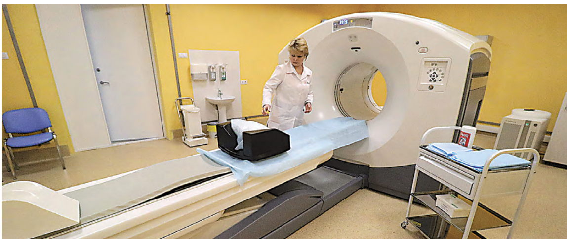
ПЭТ/КТ помогает наиболее точно определить локацию и размеры новообразований даже на ранних стадиях заболевания.